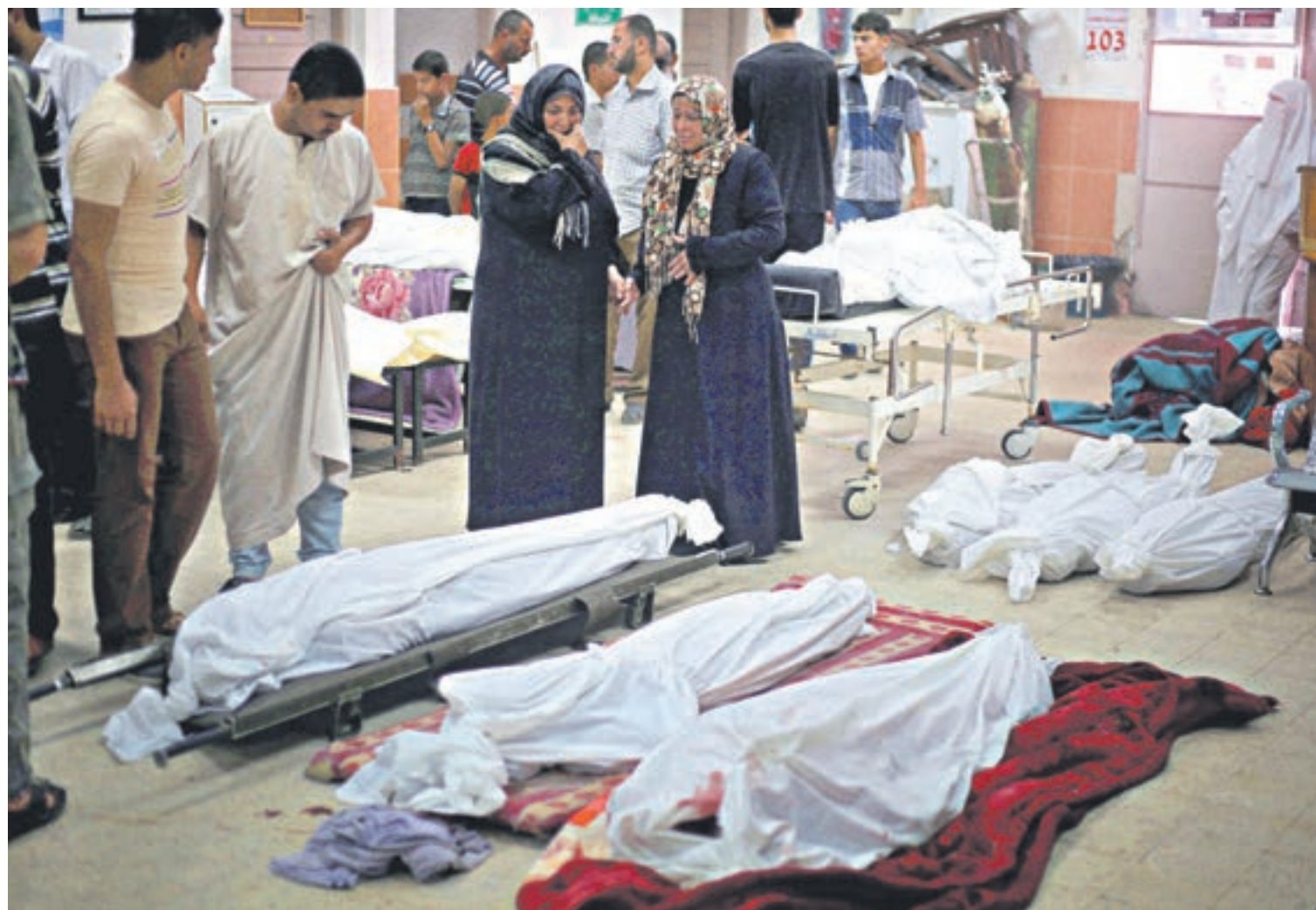
Parientes identifican los cuerpos de sus familiares muertos en el hospital Khan Yunis, al sur de la Franja de Gaza.

La poca luz que había en la Franja desapareció después de que unos proyectiles incendiaron la única central eléctrica. Los objetivos del ejército israelí son similares a los de 2006 y 2009, otras operaciones contra Hamas.