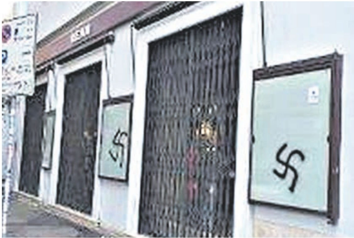
Pintadas de esvásticas aparecieron en la casa Ana Frank y en negocios de propietarios judíos.