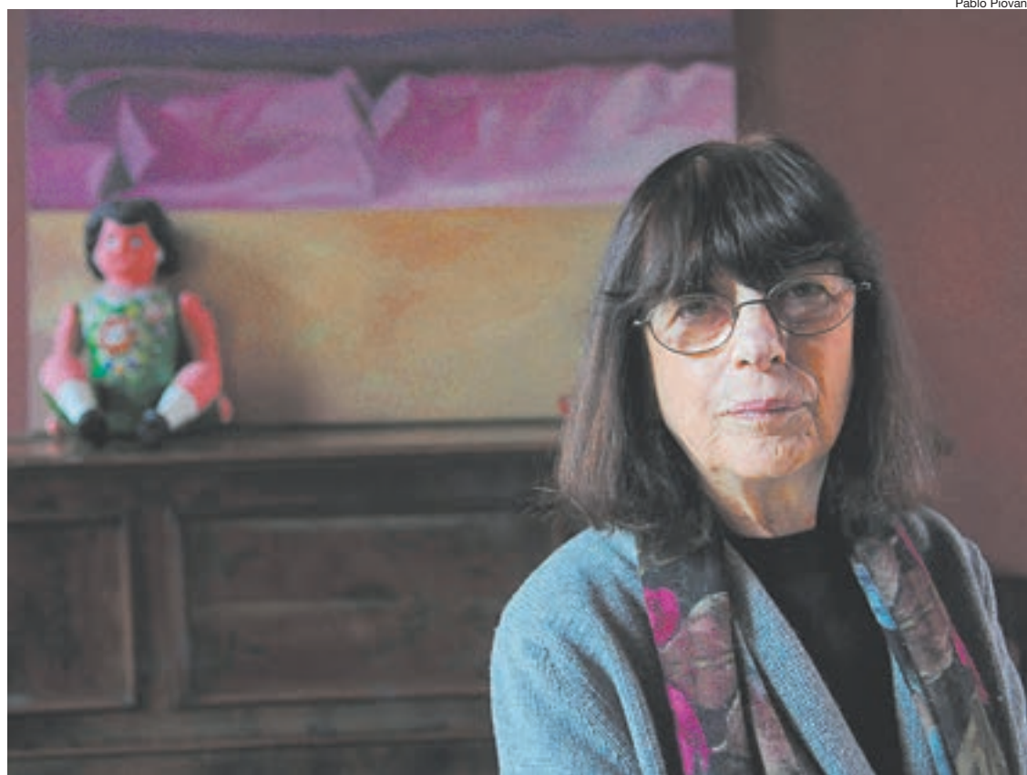
La obra dirigida por Laura Yusem va los sábados en Patio de Actores.

La directora dice que, tras el reflejo de una familia disfuncional, en su nueva puesta hay “una historia subyacente de clase social, de hijos que el patrón tiene con la criada, de muertos que no se sabe si están muertos y de enamorados que tampoco se sabe si están enamorados”.