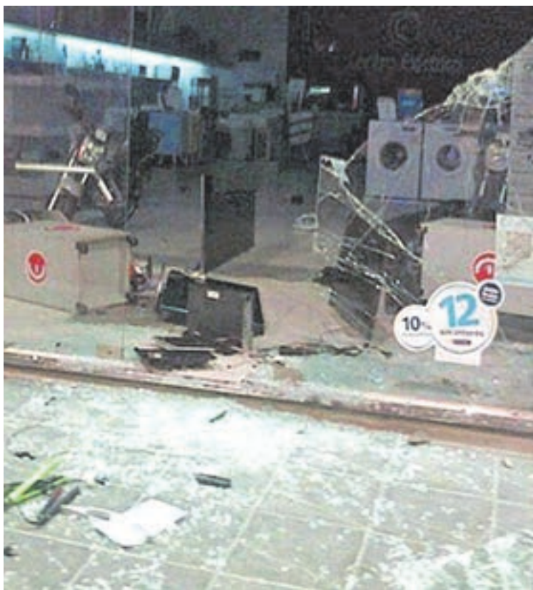
Los disturbios por el acuartelamiento terminaron con tres muertos.

Piden llevar a juicio a efectivos entrerrianos