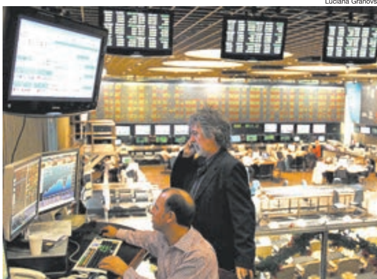
El índice MerVal de la Bolsa porteña escaló 6,5 por ciento.

Las reservas del Central, en tanto, anotaron un leve incremento para cerrar en 29.014 millones de dólares. El dato adquiere relevancia si se tiene en cuenta que esta semana el pago del vencimiento con el Club de París implicó la caída de 650 millones de dólares en el stock de divisas de la autoridad monetaria.