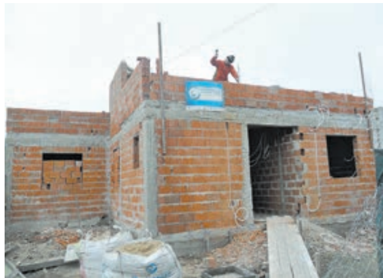
El acceso a la vivienda adecuada es una de las variables.

Uruguay, Argentina y Costa Rica lideran en la región el Índice de Inclusión Social (IIS), un estudio anual publicado por la Sociedad de las Américas y el Consejo de las Américas. El IIS muestra reducciones en los niveles de pobreza, así como mejoras en la matriculación escolar, el acceso a una vivienda adecuada y el empleo formal en algunos de los países estudiados.