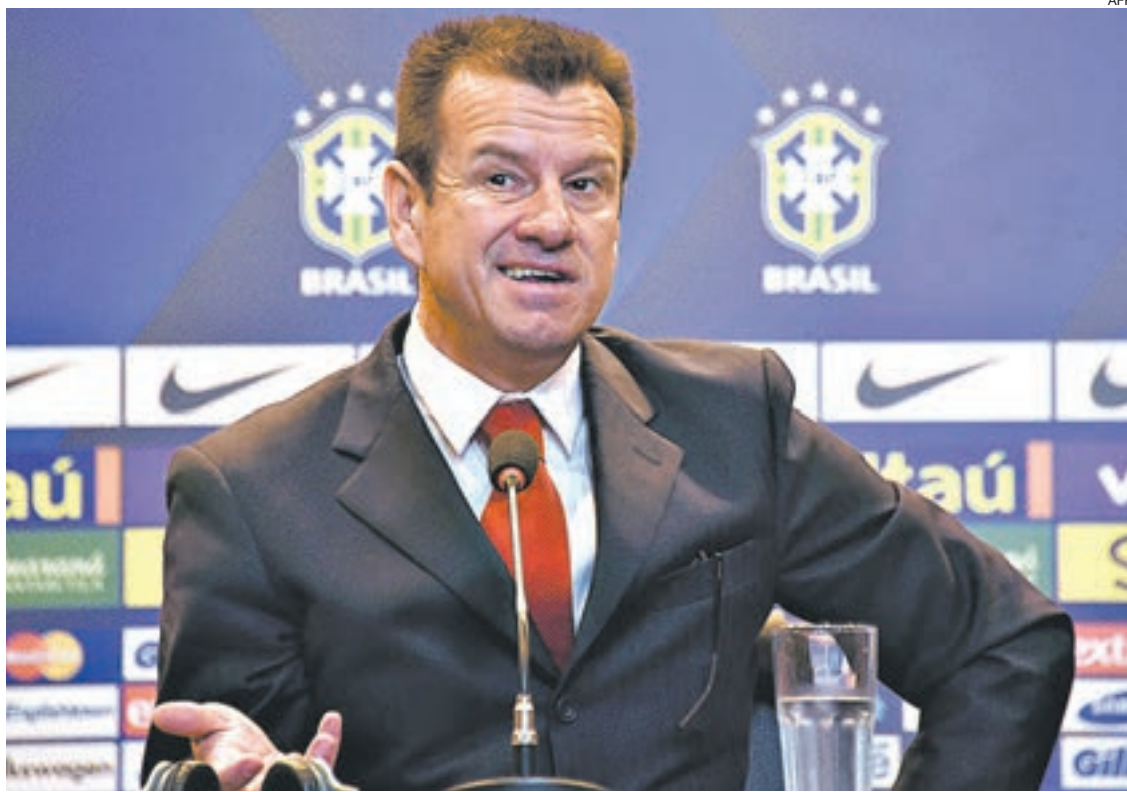
Carlos Dunga recupera el puesto que tuvo durante el Mundial de Sudáfrica 2010.