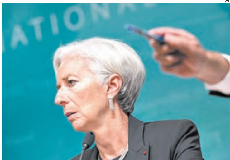
Christine Lagarde, jefa del FMI, se refirió al caso argentino.

La titular del Fondo admitió que el organismo “está obviamente siguiendo la situación de cerca, pero en ningún caso se nos ha solicitado intervención”.