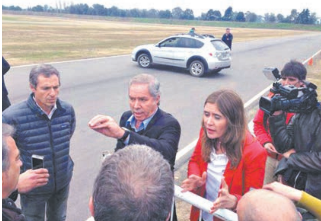
El precandidato a gobernador por el massismo cruzó su auto en la pista para frenar el evento.

El diputado del Frente Renovador irrumpió a los gritos en una actividad en un campo lindero al suyo, en la que se recaudaban fondos para niños discapacitados. “A mí me importa un carajo hacer el ridículo”, increpó a los presentes. Luego pidió disculpas.