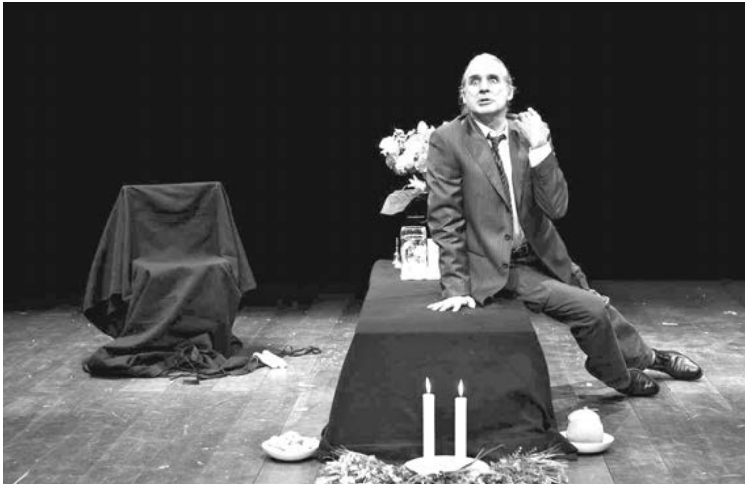
Solo los giles mueren de amor, una de las obras que se verán. "Exhibir el dolor sin provocar conciencia acerca de ese dolor es inadmisibles", dice Brie.

El teatrino argentino radicado en Italia presentará en el Complejo Cultural Banfield Teatro Ensamble cuatro unipersonales, escritos, dirigidos e interpretados por él. Todos ellos, más allá de sus diferencias, atravesados por el compromiso político.