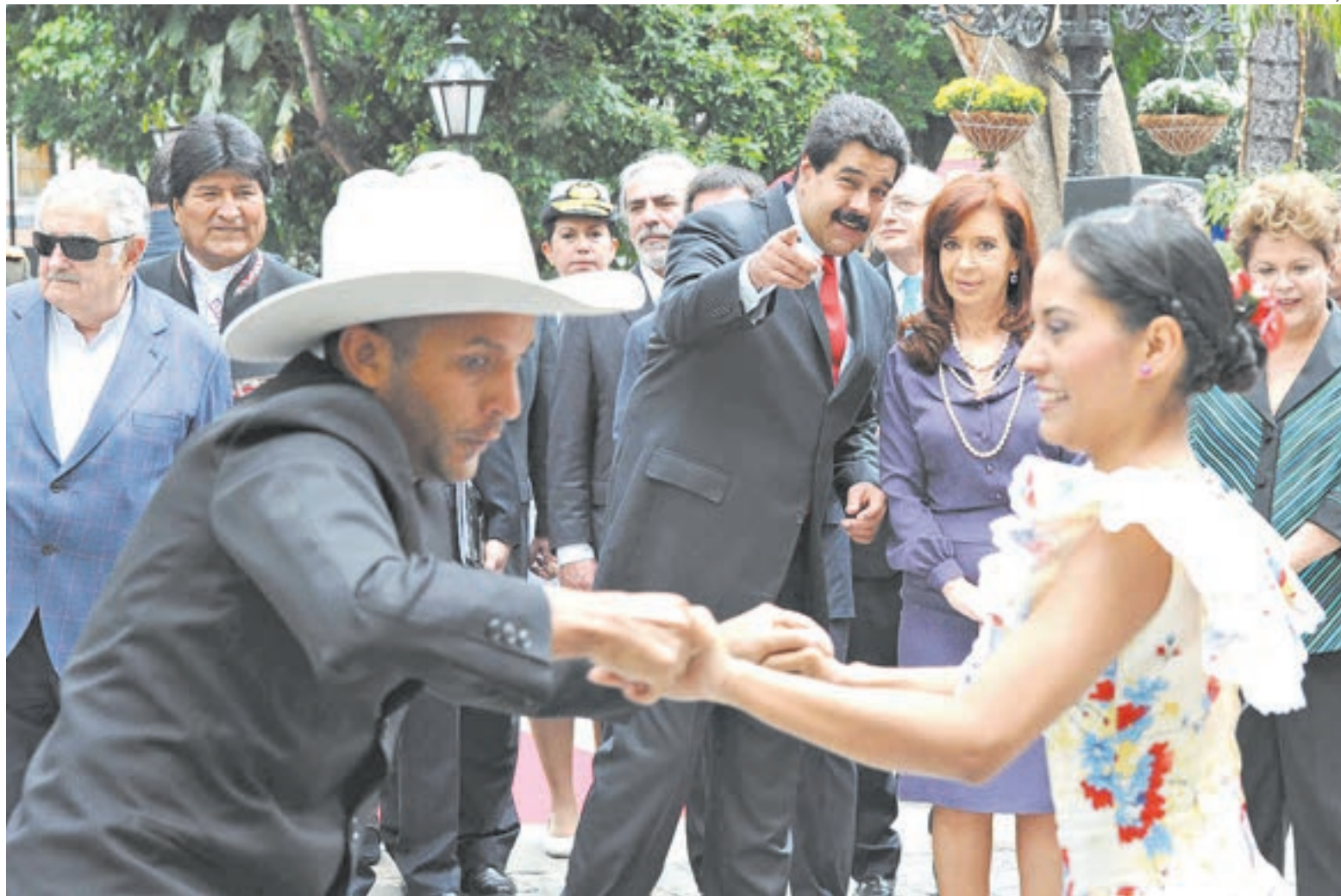
Los presidentes disfrutaron un espect culo de danza folkl rica antes del inicio de la cumbre del Mercosur.

CFK tambi n apunt  a lo que llam  la “responsabilidad desde afuera” en el origen de la deuda, porque “cuando Argentina se endeud  por encima de sus posibilidades, con un r gimen de convertibilidad durante la d cada neoliberal, tomando dinero prestado a tasas que no exist an en ninguna parte del mundo,  d nde estaba el gran auditor global, el Fondo Monetario Internacional, para evitar que esto sucediera?”, se pregunt . “As  como recorren los pa ses del mundo diciendo que no se pueden pagar tantas pensiones, no se puede pagar tanto salario,  por qu  no recorren el mundo cuando los