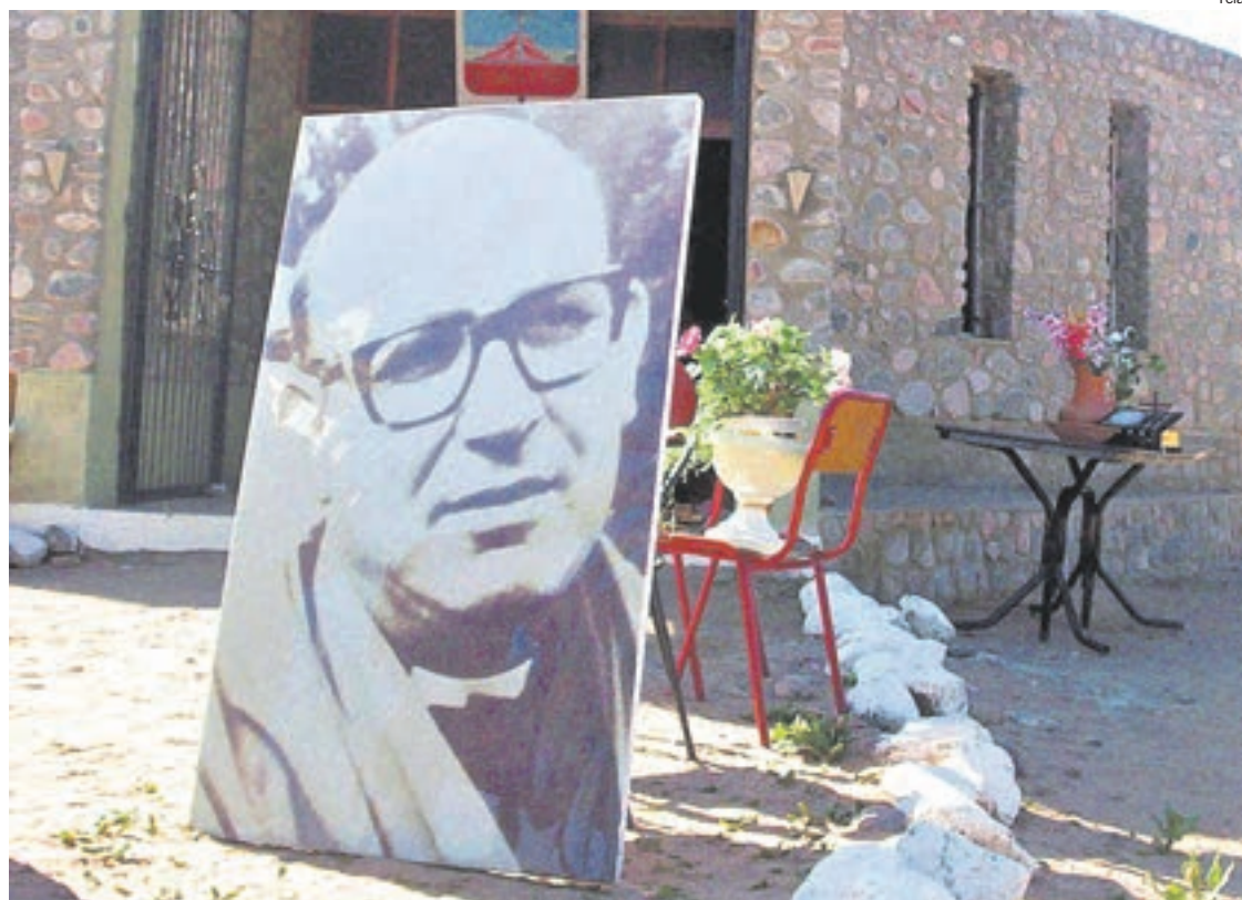
El obispo Enrique Angelelli fue asesinado el 4 de agosto de 1976.

El propio lunes 4 de agosto, cuando se cumplirán exactamen-