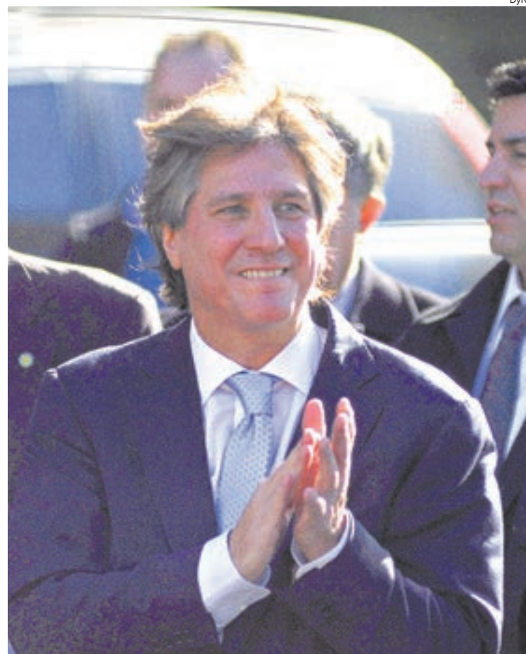
El vicepresidente, Amado Boudou, a cargo del Poder Ejecutivo.

Parrilli detalló que en la época del escándalo por las supuestas coimas que el gobierno de Fernando de la Rúa pagó a senadores para aprobar una reforma laboral, la Comisión de Asuntos Constitucionales, que presidía Elisa Carrió como diputada de la Alianza, modificó la Constitución, "que establecía que un legislador tenía que ser desafiado para poder ser indagado". Esa ley, modificada en medio del escándalo, fue señalada como una maniobra para permitir que los senadores sospechados se mantuvieran en sus bancas aprobando las leyes que el gobierno aliancista necesitaba para aplicar un plan económico que debía cumplir con las exigencias del Fondo Monetario