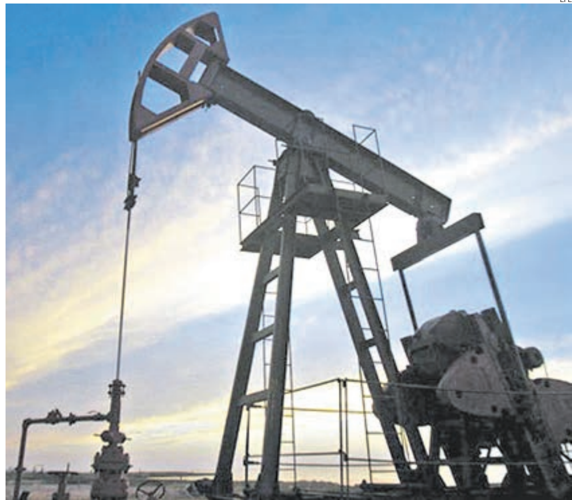
El proyecto busca garantizar las inversiones y el desarrollo productivo del sector.

Los mandatarios de tres provincias e importantes referentes de otras dos manifestaron su respaldo al proyecto. "Todos queremos lo mismo: consolidar el autoabastecimiento", afirmó Fellner (Jujuy).