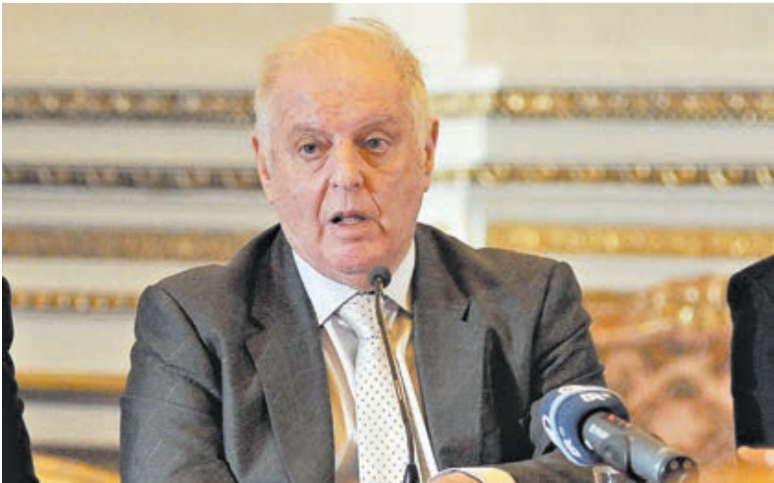
Barenboim elogió la diversidad cultural que existe en la Argentina.

Por su parte, Barenboim se proyectó sobre el conflicto en Medio Oriente: “Dejando de lado la mo-