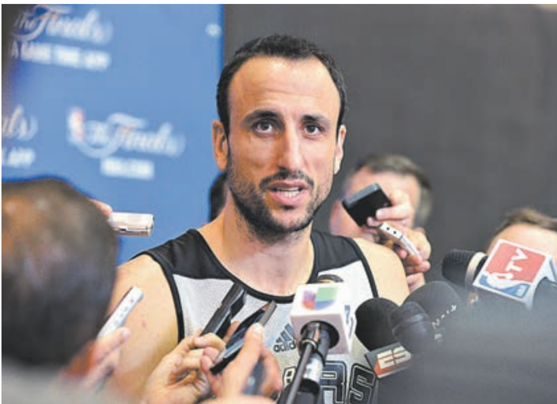
Ginóbili se está recuperando de una lesión junto a la Selección Argentina.

El lunes 11 habrá un encuentro amistoso en el gimnasio Osvaldo Casanova de Bahía Blanca, en donde el seleccionado que acudirá a España 2014 se enfrentará con el representante que integró la nómina del Sudamericano.