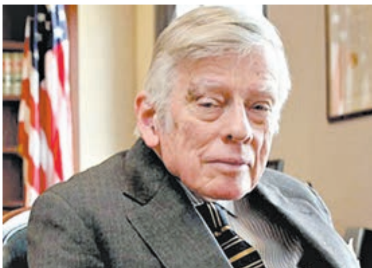
El juez de Nueva York Thomas Griesa.

3. Crear un mecanismo imparcial e independiente para resolver las controversias sobre deuda soberana basado en la obligación de respetar los derechos humanos. El mecanismo debe incluir la determinación de qué nivel de deuda es sostenible y proveer “instancias para la participación, rendición de cuentas y transparencia hacia la población del país deudor”. Entre los firmantes se destacan también Fundar, Centro de Análisis e Investigación (México), Hábitat International Coalition (HIC), Jubilee USA Network, el Observatorio de Derechos Humanos de Pueblos Indígenas, Arab Organization for Human Rights in Syria, la Asociación Pro Derechos Humanos de España (Apdhe) y Corporación Humanas.