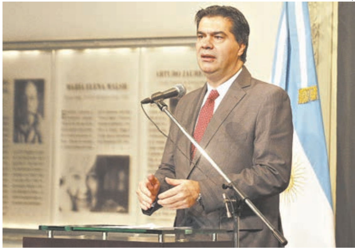
Jorge Capitanich reiteró que “este gobierno se hizo cargo de una deuda que otros contrajeron”.

“Nada es imputable en términos de responsabilidad a este gobierno”, destacó Jorge Capitanich y les atribuyó “mala fe” a los fondos buitre. En la misma línea se pronunció Oscar Parrilli y criticó la falta de acompañamiento de la oposición.