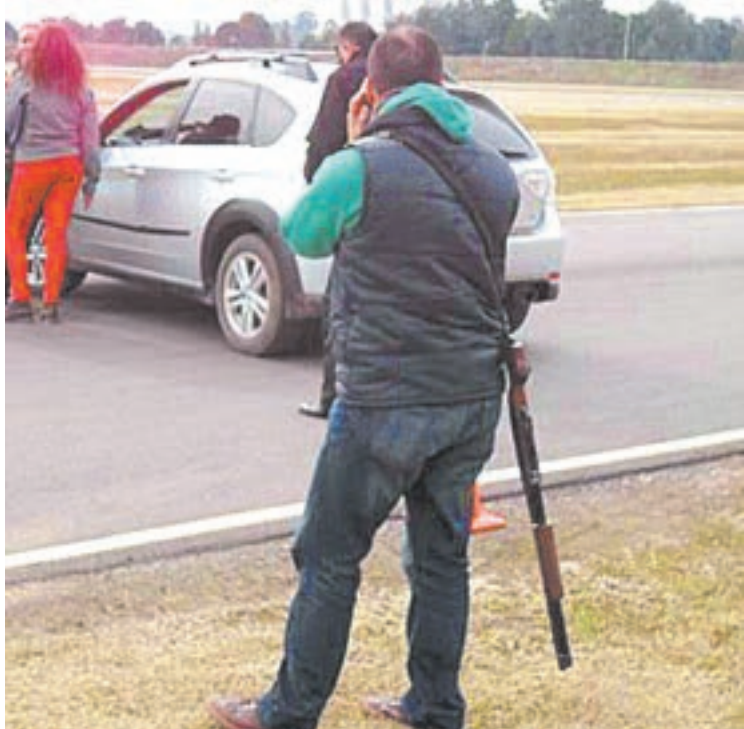
Uno de los custodios de Solá, con la Itaka en su mano.