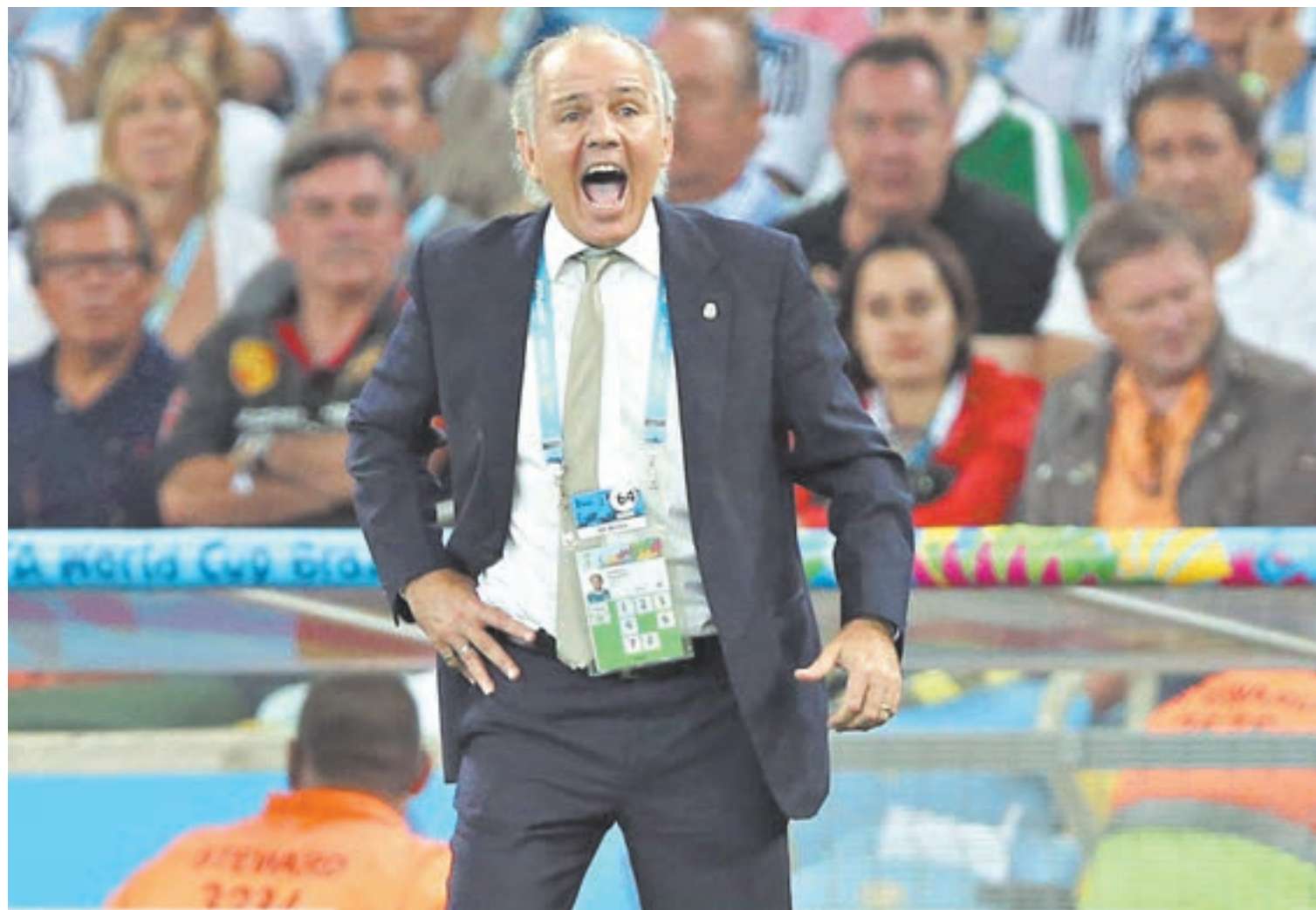
Sabella se siente "desgastado" para continuar al frente del plantel que terminó segundo en el Mundial de Brasil.

El técnico habló ayer telefónicamente con el presidente de la AFA y brindará hoy una conferencia de prensa para dar los detalles de su salida. Gerardo Martino y José Pekerman son los principales candidatos a sucederlo.