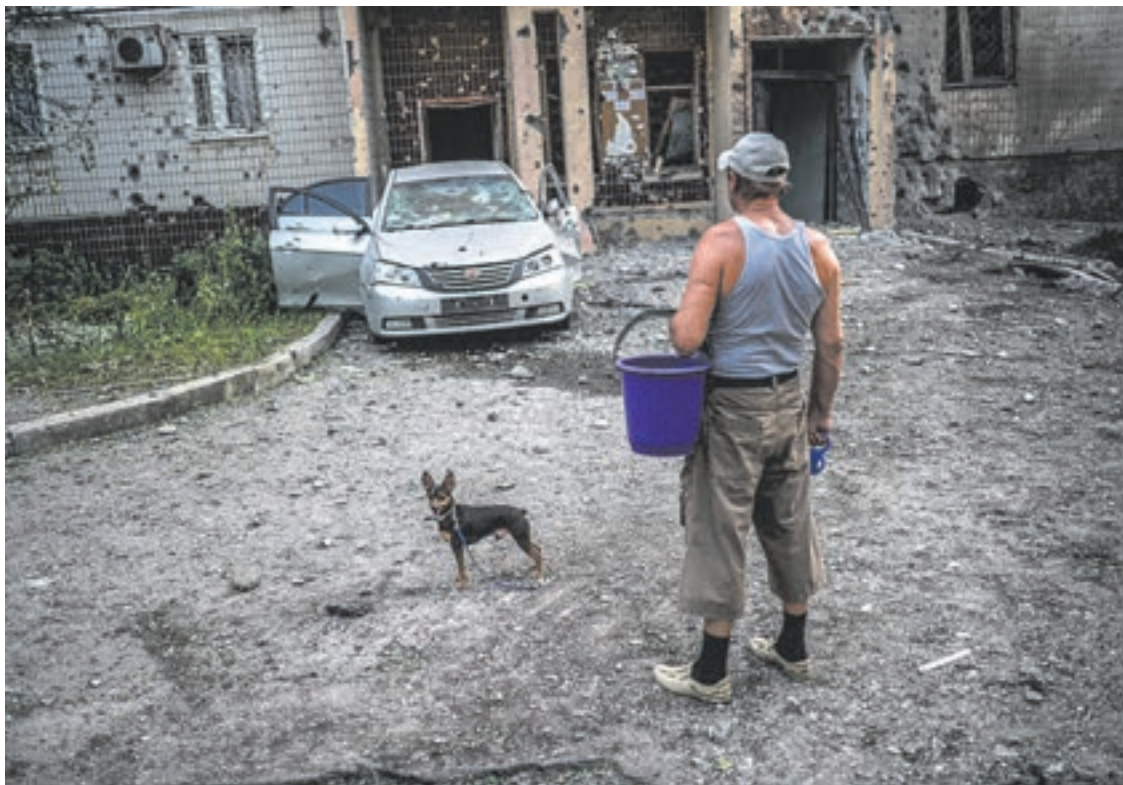
Un hombre con su perro observa su casa bombardeada en Donetsk, este de Ucrania.

Los europeos, cuya implicancia y responsabilidad en la crisis de Ucrania son inmensos, salieron de sus timoratas amenazas para concretar la tercera fase del proceso "represalias" desde que estalló esta crisis. Las sanciones, vigentes durante un año, no tienen prece-