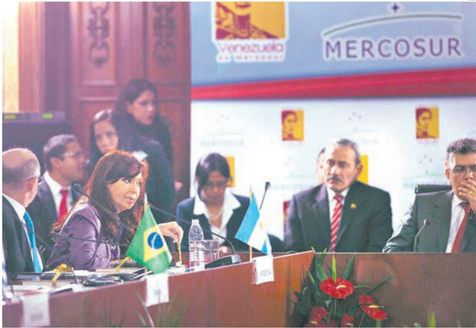
La presidenta Cristina Kirchner centró su discurso en Caracas en el litigio por los fondos buitre.

La Presidenta calificó como una “verdadera agresión” la maniobra de los fondos buitre, que “no sólo afecta a Argentina”, y reiteró su intención de pagar. El bloque manifestó su “más absoluto rechazo” a la posición de los holdouts.