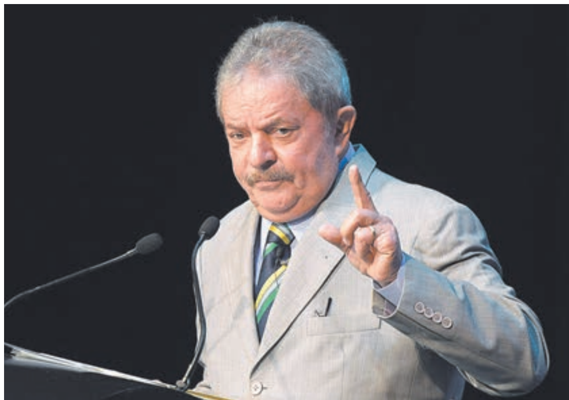
Lula criticó al Santander ante un grupo de dirigentes de la Central Unica de Trabajadores.

El ex presidente brasileño recomendó al banco que despidiera a la analista responsable del informe. Dilma dijo que hablará con el presidente y amenazó con iniciar acciones legales. Pero el candidato opositor Aécio Neves dijo que el informe era “técnico”.