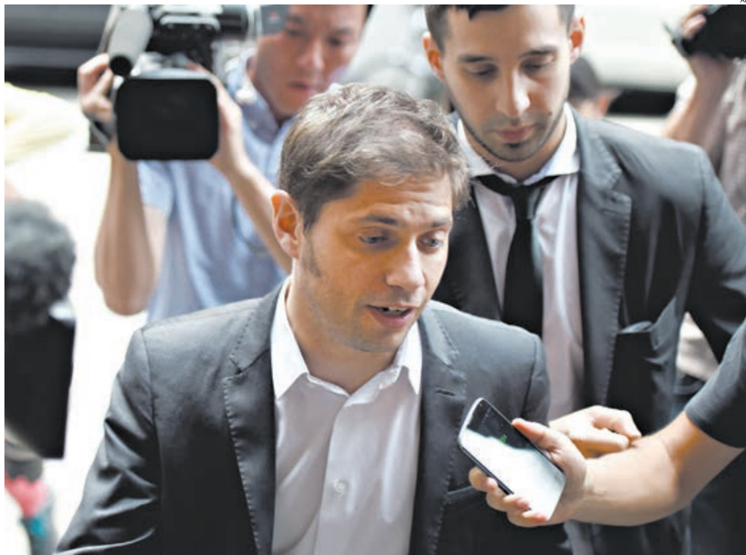
Kicillof se puso al frente de las conversaciones. Por primera vez estuvo "cara a cara" con los representantes de los buitres.