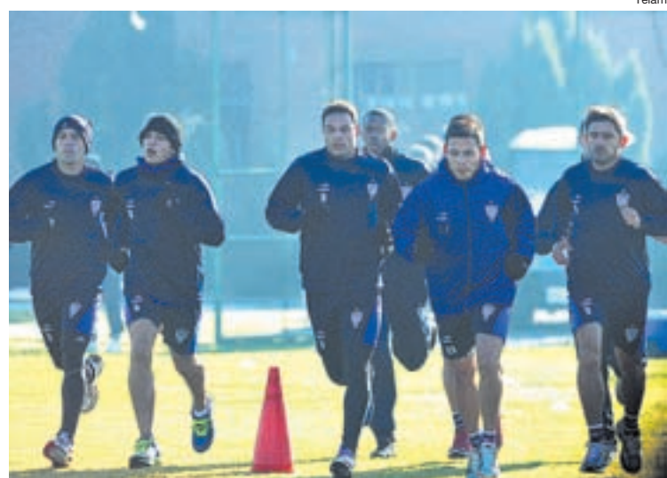
Vélez, el puntero, jugará delante de sus hinchas.