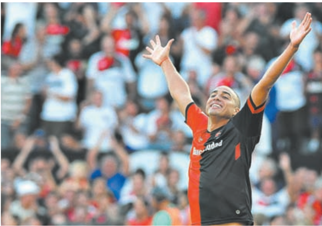
David Trezeguet, ex River y Newell's, se fue a jugar la nueva liga de la India.

En la competencia proyectada son más famosos los futbolistas que sus equipos. Incluso, sus dueños. Además de Trezeguet y Pires, se sumará una docena de jugadores españoles. Como cada franquicia podrá contratar hasta siete extranjeros, se estima que la cantidad de foráneos llegará a 56. Los desconocidos futbolistas indios que serán distribuidos en los diferentes planteles surgieron de un draft, a imagen y semejanza de los que realiza la NBA. Entre los inversores que les pagarán un sueldo a todos están los famosos actores locales John Abraham, Ranbir Kapoor y