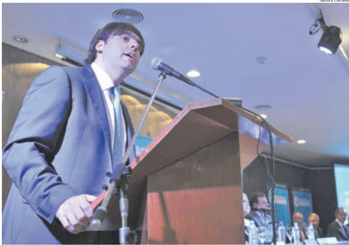
El informe que mide la evolución de las jubilaciones fue elaborado por la Anses, que conduce Diego Bossio.

Entre junio de 2003 y el valor que entrará en vigencia próximamente, la jubilación mínima pasó de 150 a 3231,63 pesos, un aumento acumulado del 2054 por ciento. En el mismo período, la remunera-