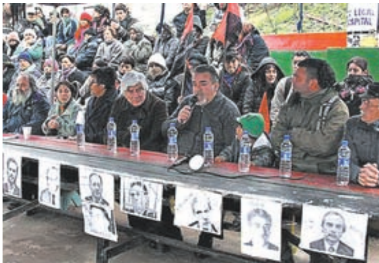
Familiares y organizaciones políticas en una conferencia de prensa.