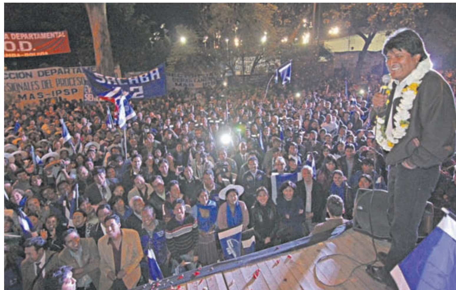
Inequivocadamente, todos los indicios apuntan a que Morales será elegido por tercera vez presidente de Bolivia.

A menos que suceda algo imprevisto, Morales obtendrá la reelección. Lo que está en juego en las elecciones del 12 de octubre es el porcentaje con el cual el oficialista Movimiento Al Socialismo dominará la Asamblea Legislativa.