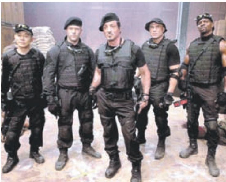
Lo mejor de la saga Indestructibles es su autoconciencia.

Pero un giro de guión (¡ay!, los giros de guión...) hace que Barney Ross (Stallone) decida prescindir de la tropa de veteranos que lo acompañó hasta acá con una fidelidad literalmente a prueba de balas, para formar un nuevo equipo de mercenarios capaz de acertar donde el otro, por una vez, no pudo. El cambio de dirección resulta un paso en falso: hasta acá la saga ofrecía disfrutar viendo a una caterva de héroes old school rebuscándose a pesar de las arrugas, de los achaques y hasta de estar físicamente imposibilitados de tirar siquiera una patada al aire como Dios manda (tal el caso del inmortal Chuck Norris en Los Indestructibles 2 ). Un retroceso para incorporar a media docena de jóvenes sin ningún carisma, y cuyo único punto a favor es haber conseguido que Antonio Banderas entregue su mejor personaje (dicho con absoluta convicción y sin ironías) desde el Gato con Botas de Shrek .