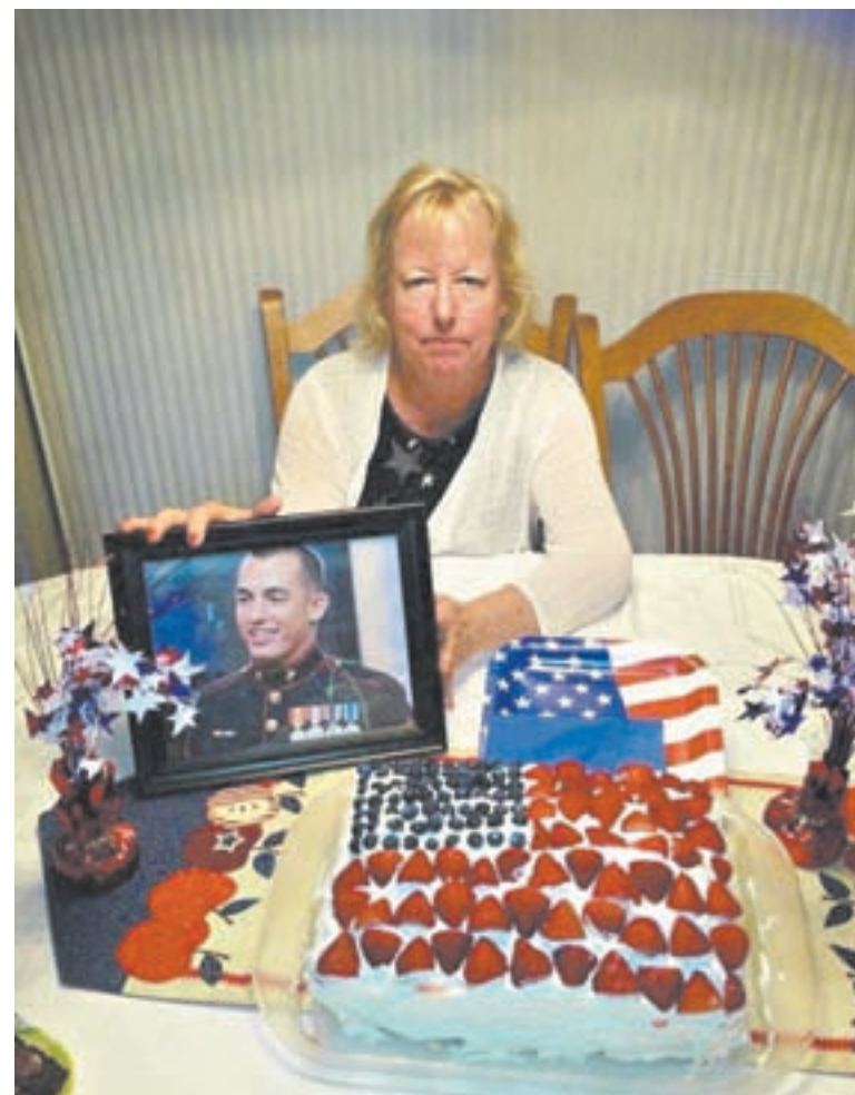
La madre junto a la foto de su hijo Andrew Paul Tahmooressi.

Una prueba de las demostraciones de solidaridad que recibió Tahmooressi está en el Facebook “Free United States Marine” (Liberad al marine de Estados Unidos). Sus defensores subieron docenas de fotos con carteles donde pueden leerse mensajes como