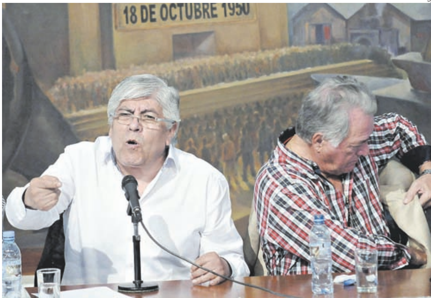
El líder de la CGT opositora, Hugo Moyano, y el de la Azul y Blanco, Luis Barrionuevo.

El jefe de Gabinete insistió con que quienes protagonizan la huelga “son perfectamente funcionales a la estrategia de los fondos buitres”. Habrá colectivos y subte (menos la línea B y Premetro) y no funcionarán los aviones y los trenes.