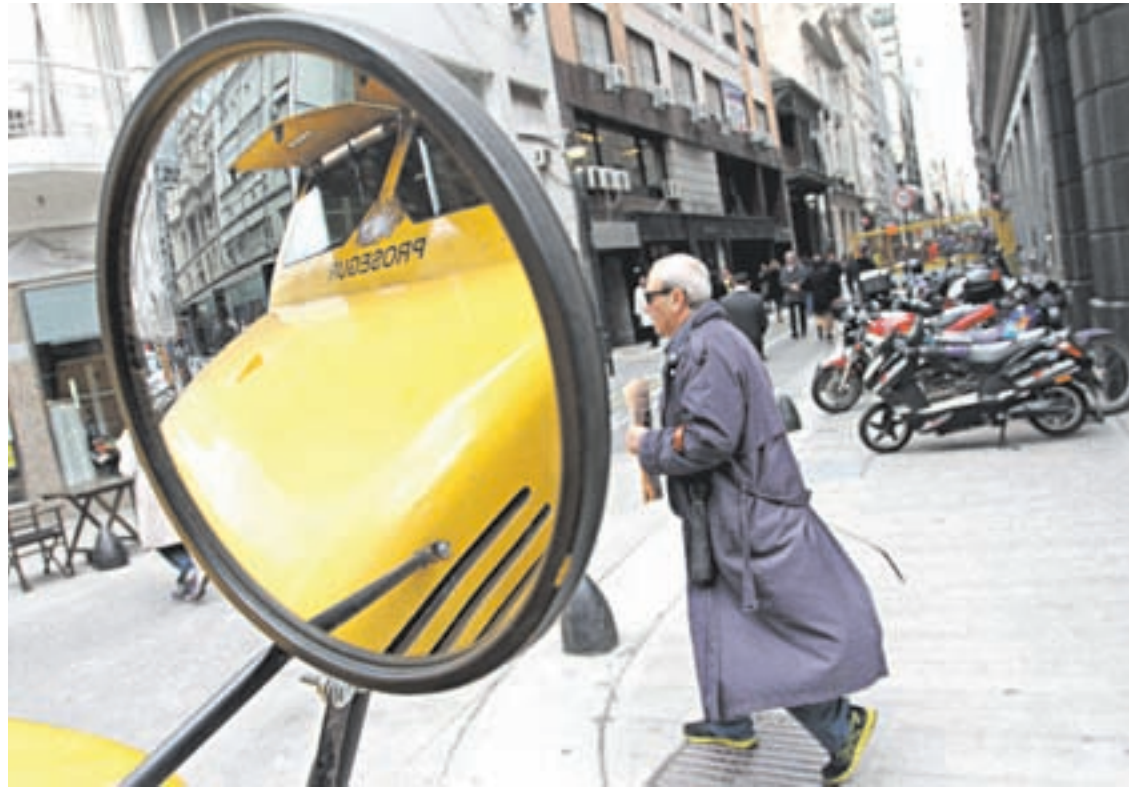
Las operaciones en el marginal, con escaso monto, se efectuaron a 14,45 pesos.

La presión de la demanda especulativa elevó inicialmente el precio de la divisa en operaciones de transferencia (Bolsa o contado con liqui). La intervención oficial frenó la suba.