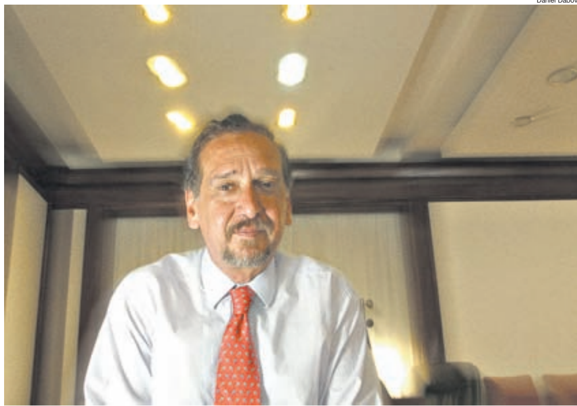
“Las autoridades actuales del Banco son interinas y no se presentaron al concurso”, dijo el ministro Lino Baraño.

Baraño explicó que el organismo se dedicará sólo a los casos de niños apropiados durante la dictadura debido a “la necesidad de actuar con celeridad”, pero señaló que “hay 22 sitios, en su mayoría públicos, que ofrecen el mismo servicio que el BNDG”.