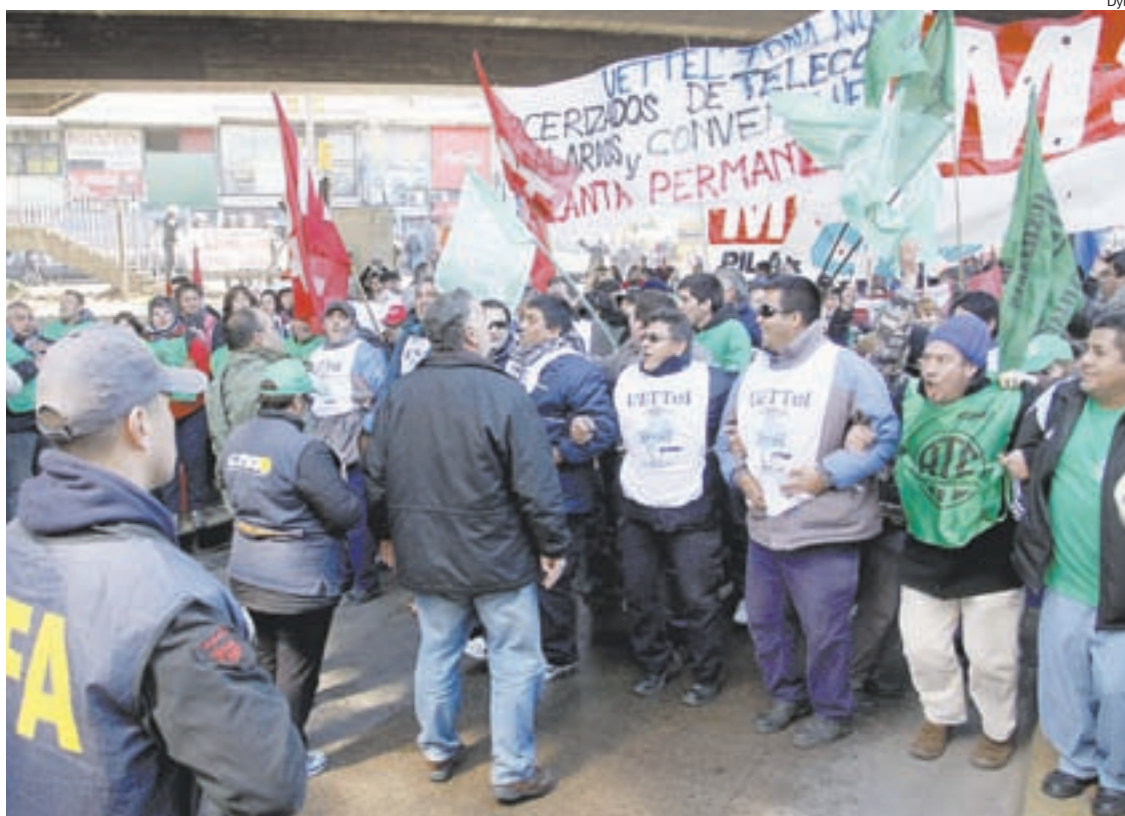
Los cortes se repitieron en Acceso Norte, Autopista Ricchieri, Puente Pueyrredón y otros puntos.

el secretario de Seguridad, quien calificó a los manifestantes como “un grupo minúsculo de irracionales” que no va a “resolver” el conflicto de los despedidos de la autopartista “cortando” el tránsito.