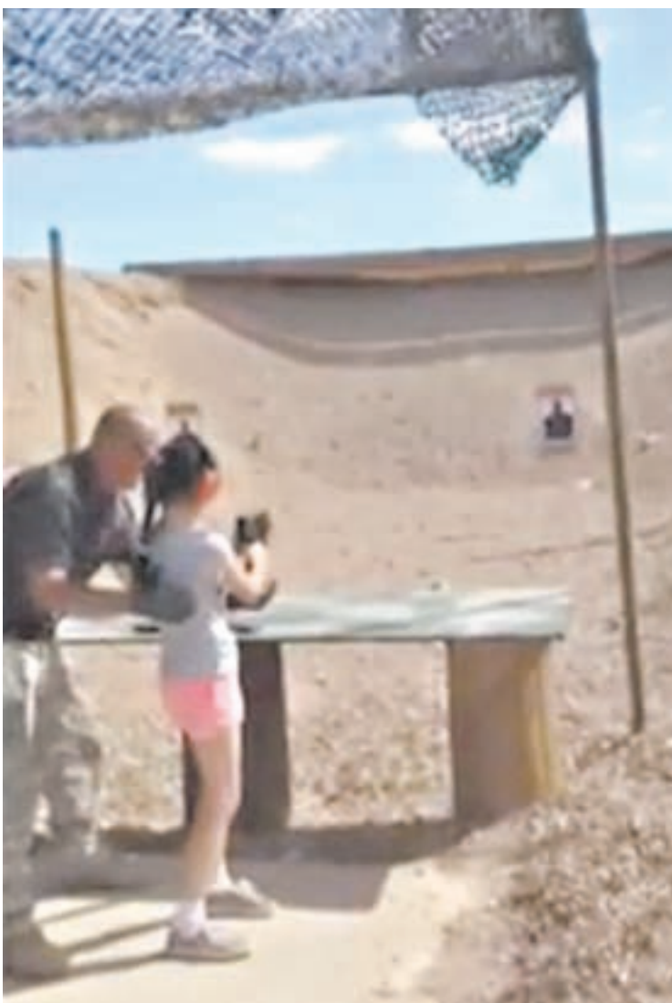
Imagen tomada del video en el que la nena prueba con la Uzi.

Por ley, en Arizona es preciso tener al menos 18 años para cargar armas, pero, a la vez, esa disposición no se aplica sobre lo que suceda en una propiedad privada, o si la persona menor de edad está acompañada por uno de sus padres o de un instructor certificado.