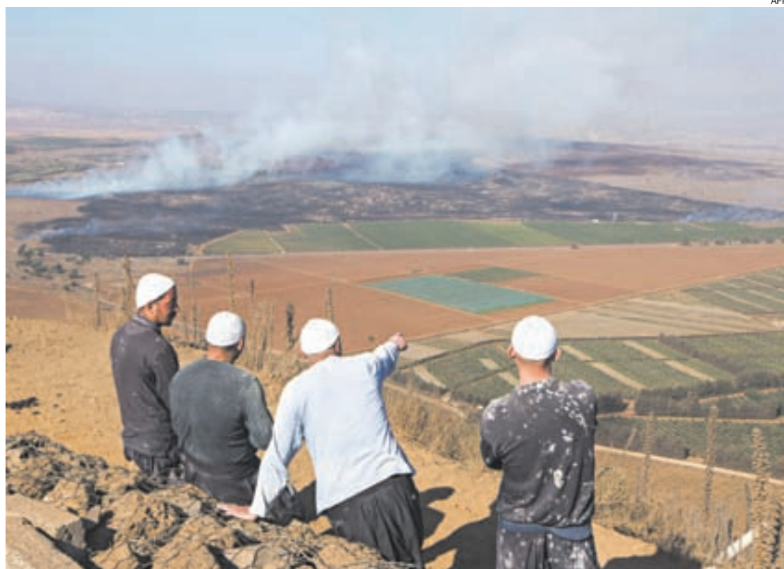
Drusos observan de los Altos del Golán el humo que aumenta a raíz de los combates en Siria.

En la guerra siria, las ejecuciones públicas de civiles, las amputaciones y los latigazos se convirtieron en un espectáculo habitual los viernes en las zonas controladas por los jihadistas del Estado Islámico, según la ONU.