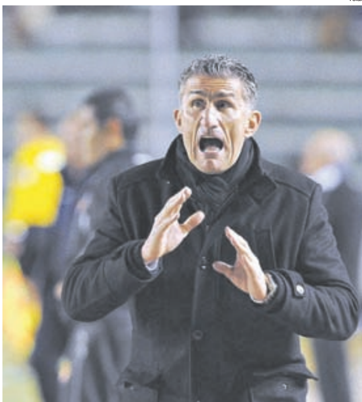
Edgardo Bauza quiere solucionar los problemas de San Lorenzo.

San Lorenzo no convirtió en lo que va del torneo. “Contra Banfield llegamos con más ganas que ideas —admitió Bauza—. Pero con la característica de jugadores que tenemos el equipo tiene que generar más.” Y aclaró: “Prefiero jugar con un punta solo, pero siempre el otro se tira atrás y se mueve. El otro día lo hicieron Blandi y Cauteruccio. Cuando esté bien el Pipi (Romagnoli) o Barrientos vamos a ver si pueden jugar ahí para tener un enlace. Eso no quita que juegue con dos puntas, si lo necesitamos. Depende de los otros jugadores que pueden trabajar en esa posición”.