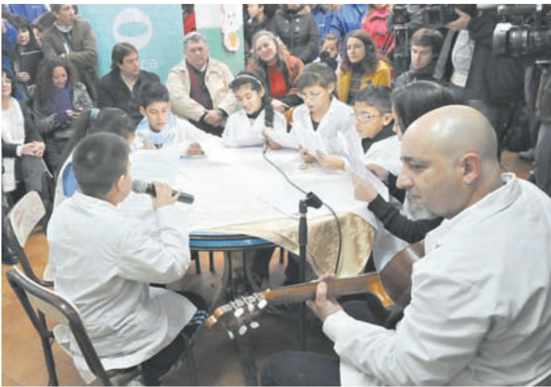
Al taller de radio concurrirán unos 30 alumnos de 5° y 6° grado del barrio Ejército de los Andes.