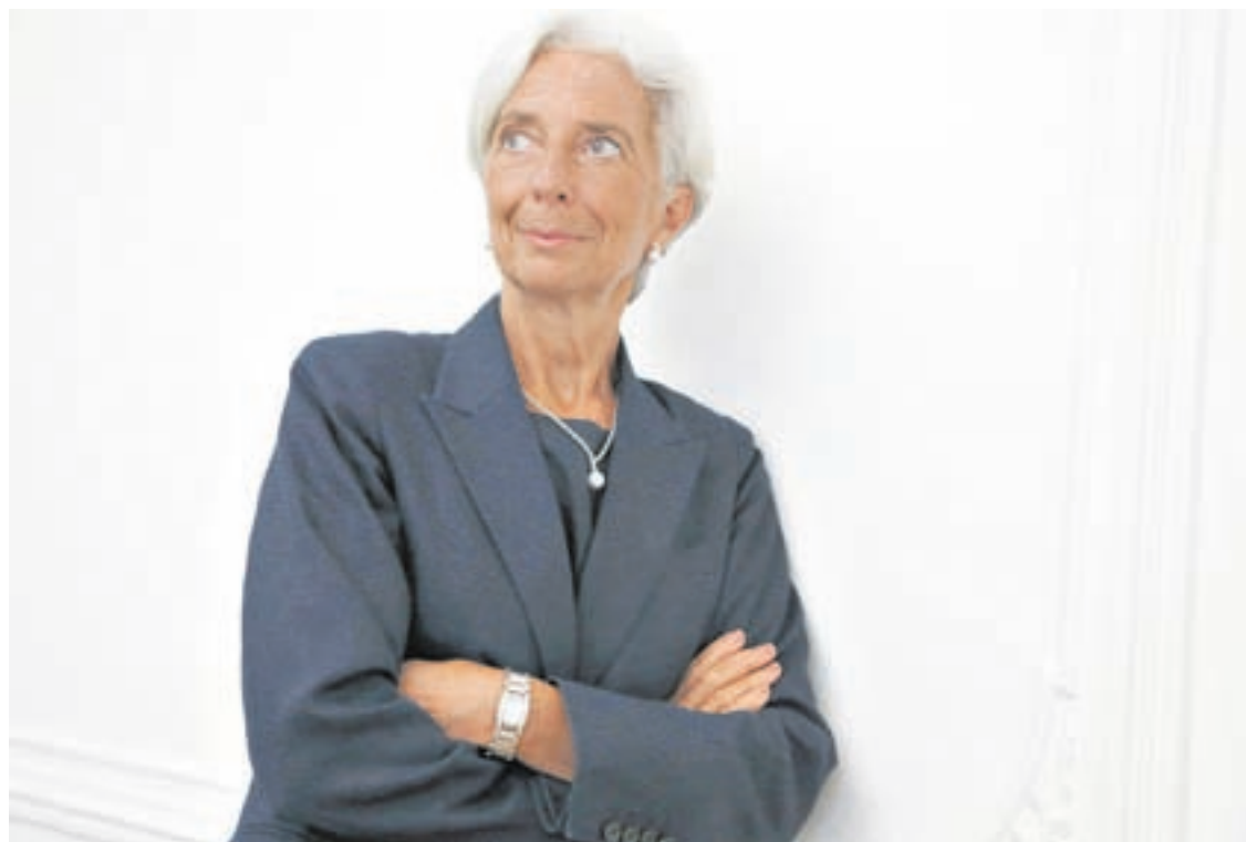
Christine Lagarde es la sexta imputada en el caso que involucra al empresario Tapie.

Después de comparecer ante los jueces, la funcionaria dijo que volvía a Washington para proseguir con su trabajo al frente del FMI, al tiempo que consideró “infundadas” las acusaciones sobre su accionar en el Ministerio de Economía.