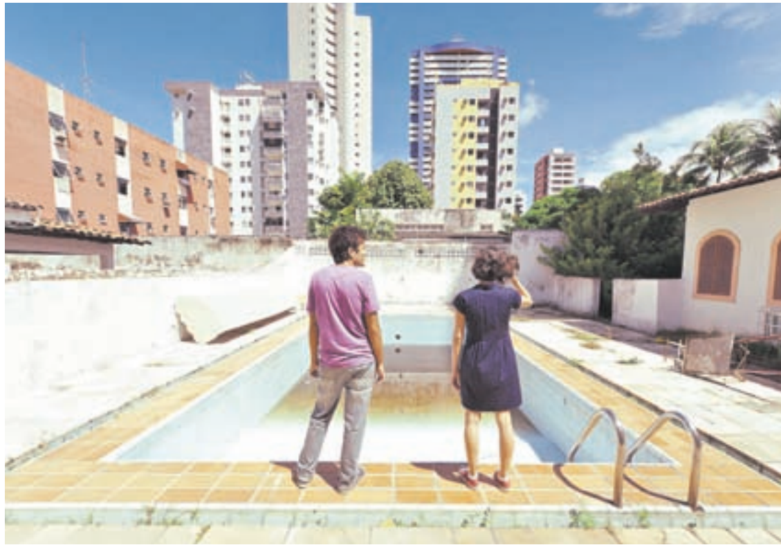
Una piscina abandonada parece expresar el extraño vacío que se abre ante los personajes.

En la excelente ópera prima de Mendonça Filho hay toda una serie de niveles de lectura e interpretación que nunca están enunciados de manera explícita, sino que deben ser inferidos.