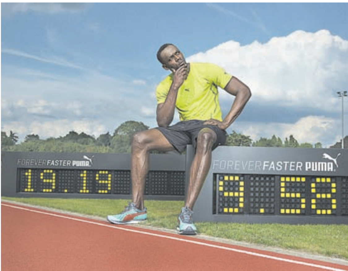
Bolt y sus primados mundiales de 200m y de 100m. Los instaló hace ya cinco años.

Cuatro días más tarde, el 20, Bolt, que estaba a un día de cumplir 23 años, ganó los 200 metros. "Fue una experiencia similar —recuerda—. La verdad que logré administrar mi energía para la final, ya que sabía que iba a necesitar-