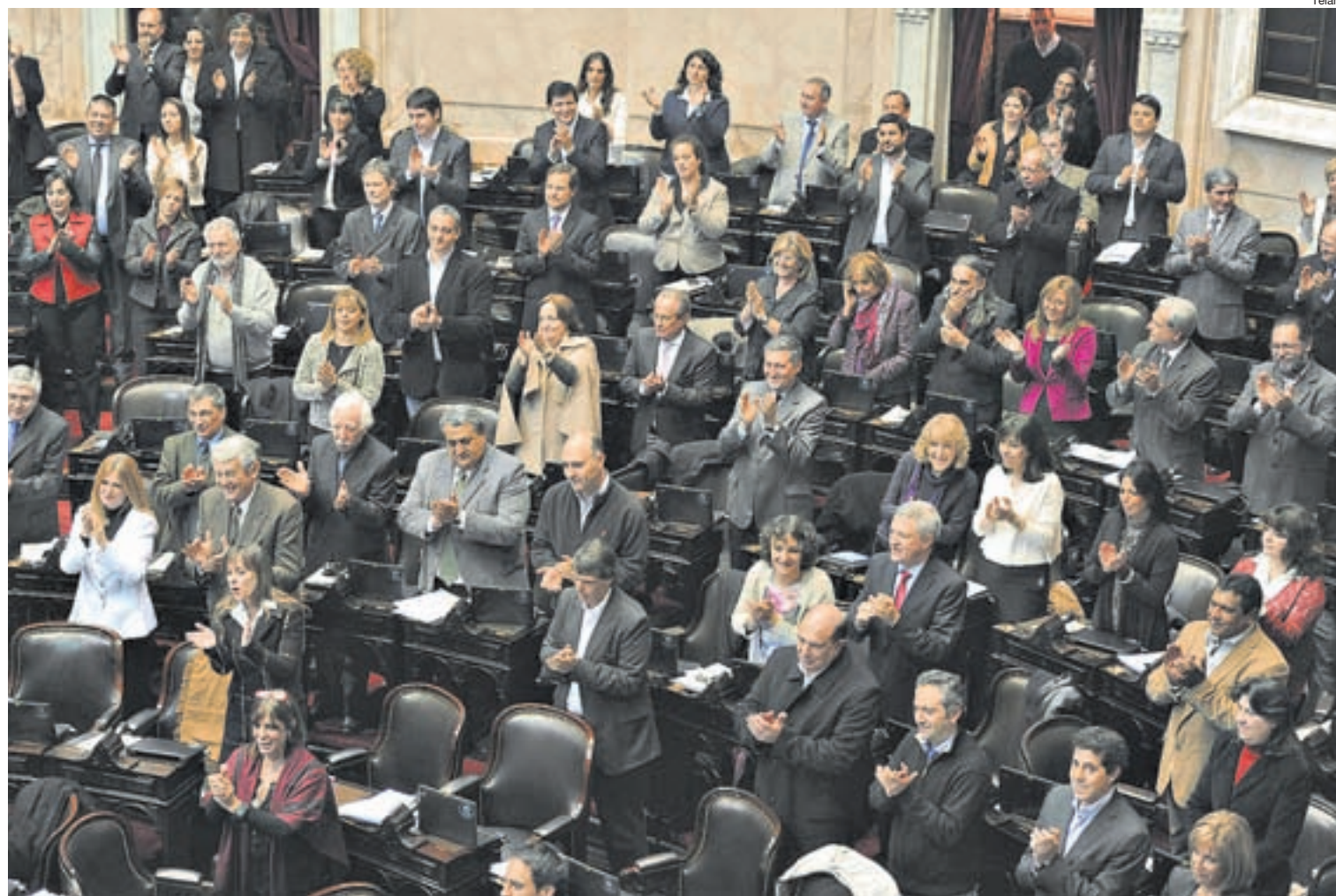
Oficialismo y oposición coincidieron en la necesidad de aprobar la nueva moratoria para aumentar la cobertura previsional.

El proyecto del Gobierno tuvo el respaldo de la oposición, aunque la mayoría de los bloques objetaron algunos puntos. La iniciativa les permitirá acceder a la jubilación a más de 500 mil personas, la mayoría del 30 por ciento más pobre de la población.