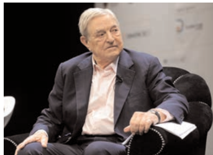
George Soros, administrador del fondo Quantum Partners.

El monto en títulos bajo ley europea en poder de ambos fondos asciende a aproximadamente 1300 millones de euros. El juez citó a nueva audiencia para dentro de un mes, y antes de ese plazo debería hacer “la consulta” a los holdouts antes de fijar posición ante el reclamo de Quantum Partners y Hayman.