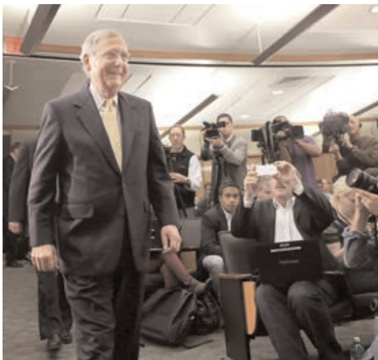
El líder republicano en el Senado, Mitch McConnell.

Quienes se encaminan a liderar el nuevo Congreso, ante un electorado por demás preocupado porque las futuras generaciones vivan por primera vez peor que sus padres, aseguran que sus primeras medidas apuntarán a fortalecer la economía y el empleo. Los republica-