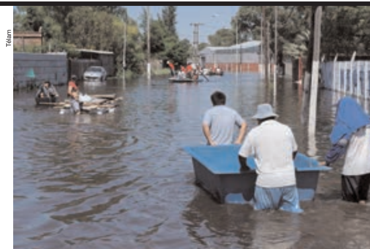
Transradio, en Esteban Echeverría, uno de los barrios más afectados.

donaciones de pañales, leche en polvo larga vida, agua mineral y alimentos no perecederos. Todo lo donado es entregado a Red Solidaria, que luego realiza la entrega a los damnificados, informó la firma a través de un comunicado.