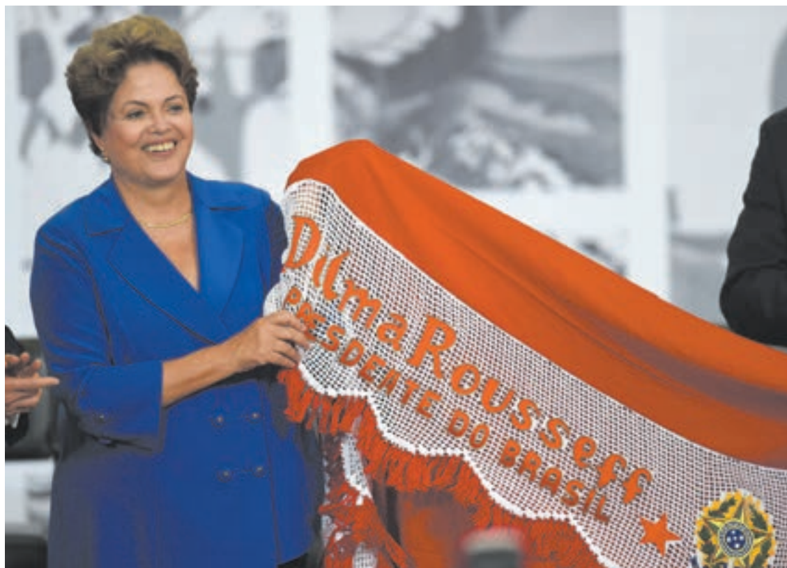
Dilma en el Palacio del Planalto, Brasilia, en su reaparición pública tras su reelección.

Durante una entrevista a diarios locales que será publicada por completo hoy, la jefa de Estado preguntó “por qué cualquier sector tiene regulación y los medios no pueden tenerla” y luego citó la “dura” legislación de medios británica y los delitos cometidos por el diario News of The