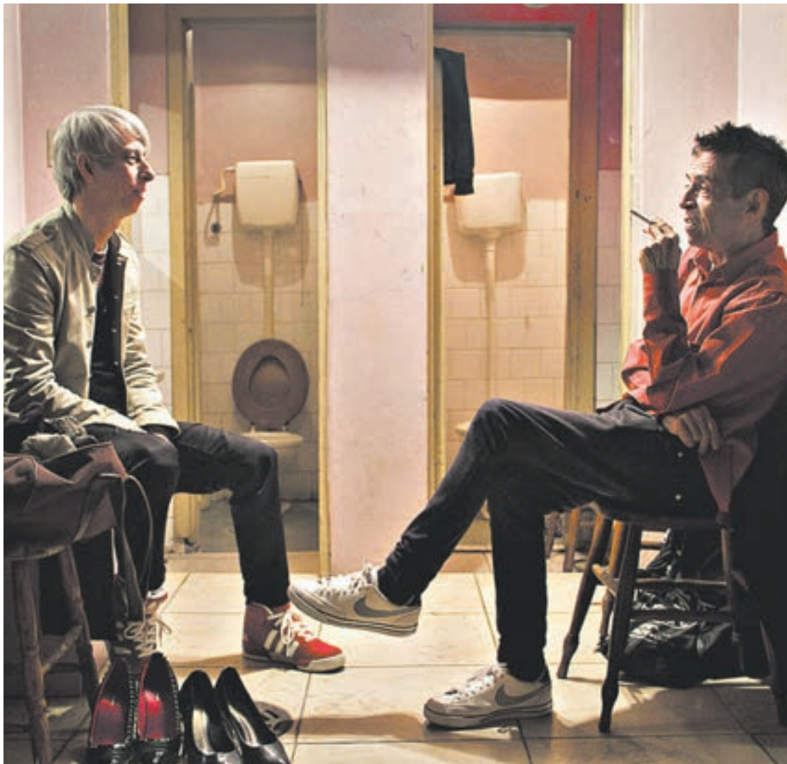
Castanha no es un melodrama exacerbado ni un drama realista de manual.

de realidad y cuánto de ficción en la película terminada? Poco importa. Y tal vez la pregunta deba tomar otra dirección y concentrarse en el concepto de “verdad”, que el film intenta aprehender a partir de Castanha, su entorno y relaciones, su trabajo, creaciones y anhelos. La relación del protagonista con su madre y la de ésta con su nieto, un joven atrapado en el consumo de drogas duras, ocupa una parte esencial del relato, pero el film de Davi Pretto evita los caminos más tentadores para esta clase de historias: la sordidez y/o la falsa ternura. Castanha no es un melodrama exacerbado ni un drama realista de manual, y el estilo híbrido que lo atraviesa —incorporando recuerdos, sueños, fantasías e incluso una película dentro de la película— se transforma en la mayor de sus virtudes. Eso y una nocturna melancolía que salpica el relato de principio a fin.