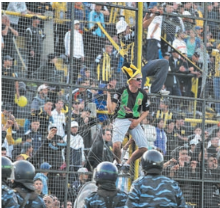
Se escucharon entre 20 y 25 disparos.