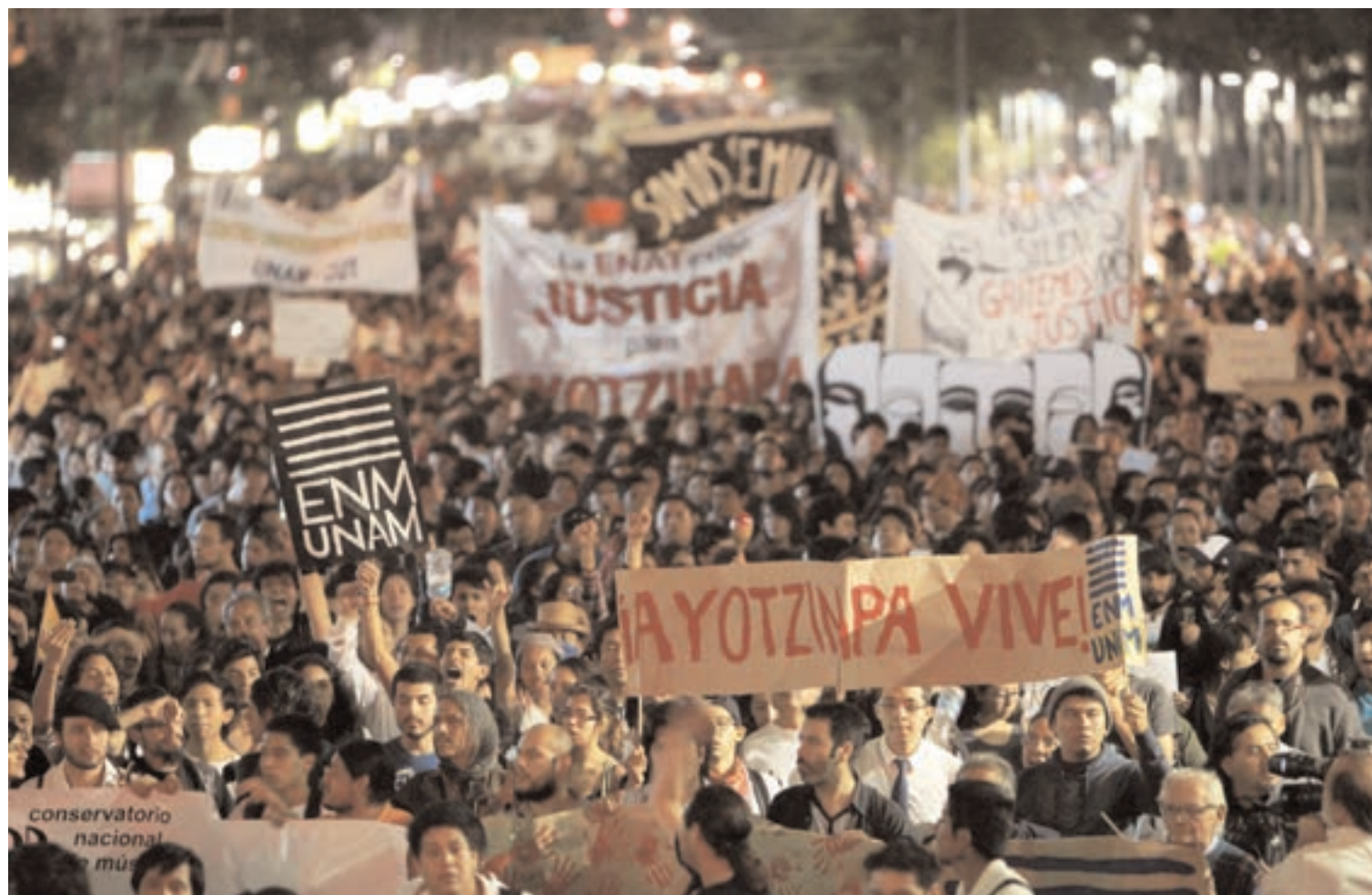
Miles de ciudadanos marcharon en la capital mexicana pidiendo por la aparición de los 43 estudiantes de Ayotzinapa.

La crisis política que le estalló en las manos a Peña Nieto refleja el efecto que ha tenido la desaparición forzada de 43 estudiantes de Ayotzinapa, por la cual están detenidos el ex alcalde de Iguala, policías y sicarios.