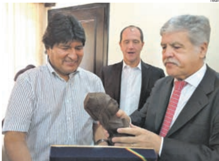
De Vido y Evo Morales, reunidos en Santa Cruz de la Sierra.

La negociación con el país vecino no sólo contempla la posibilidad de venderles radares sino también asesorarlos en la implementación de la televisión digital terrestre, ya que ambas naciones adoptaron la norma nipona-brasileña ISDB-T. También se busca fortalecer la cooperación espacial en satélites de telecomunicaciones y en energía nuclear. "La presidenta Cristina Fernández de Kirchner nos instó a avanzar en este proceso de integración que iniciaron los presidentes Néstor Kirchner y Evo Morales, a partir de las exportaciones de gas a la Argentina", aseguró De Vido.