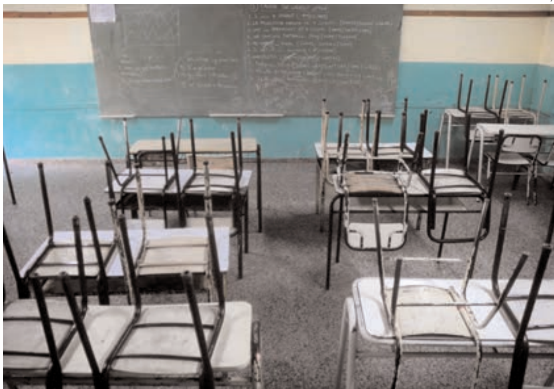
Las clases en las escuelas bonaerenses no se dictarán normalmente la semana que viene.