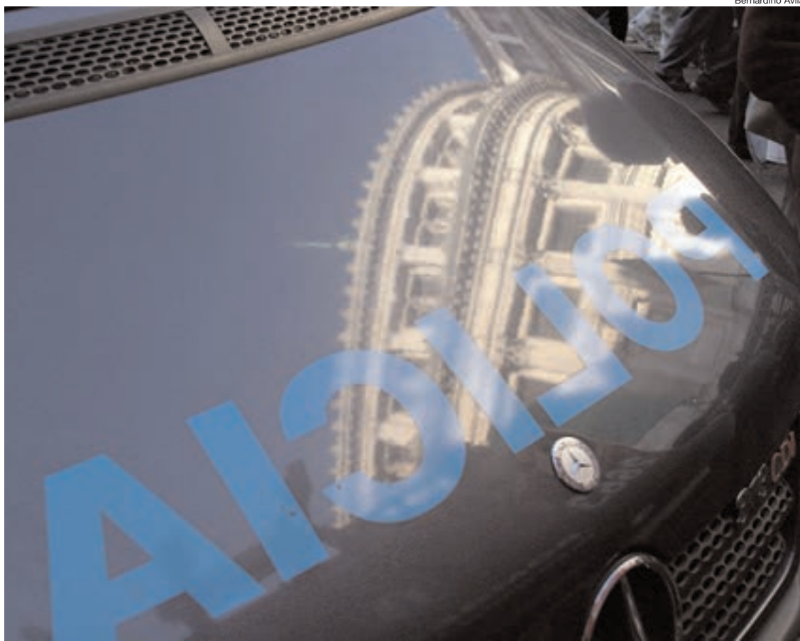
La investigación se inició porque un policía denunció a sus colegas que abusaban de las niñas.

El fallo de la sala VII de la Cámara del Crimen que confirmó los