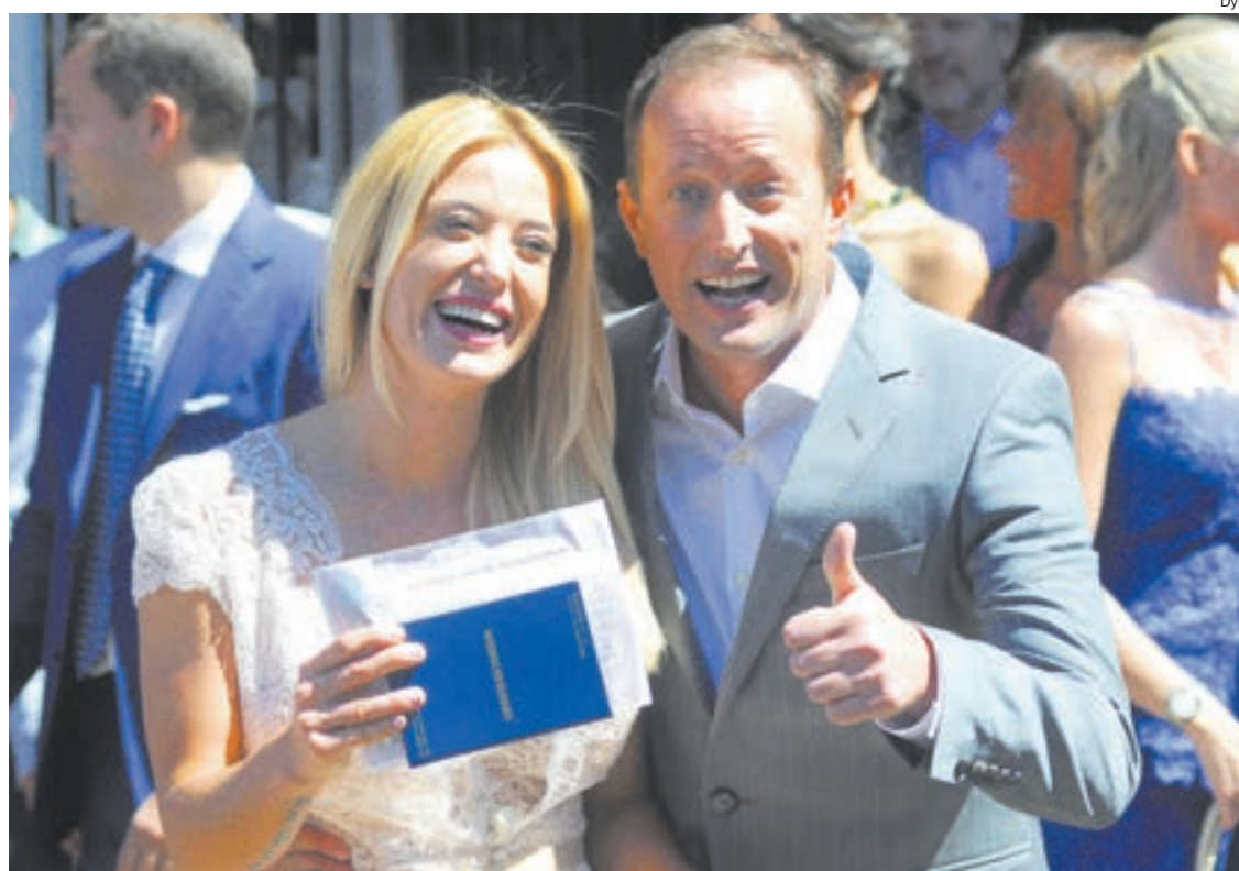
Jésica Cirio y Martín Insaurralde se casaron y luego atendieron a varios programas de televisión.

Mediático desde su inicio, el romance entre Insaurralde y Cirio quedó ayer formalizado en el Registro Civil de Lomas de Zamora. Mañana será la fiesta en la que se mezclarán políticos y farándula: Scioli, Massa, Tinelli y Mirtha Legrand.