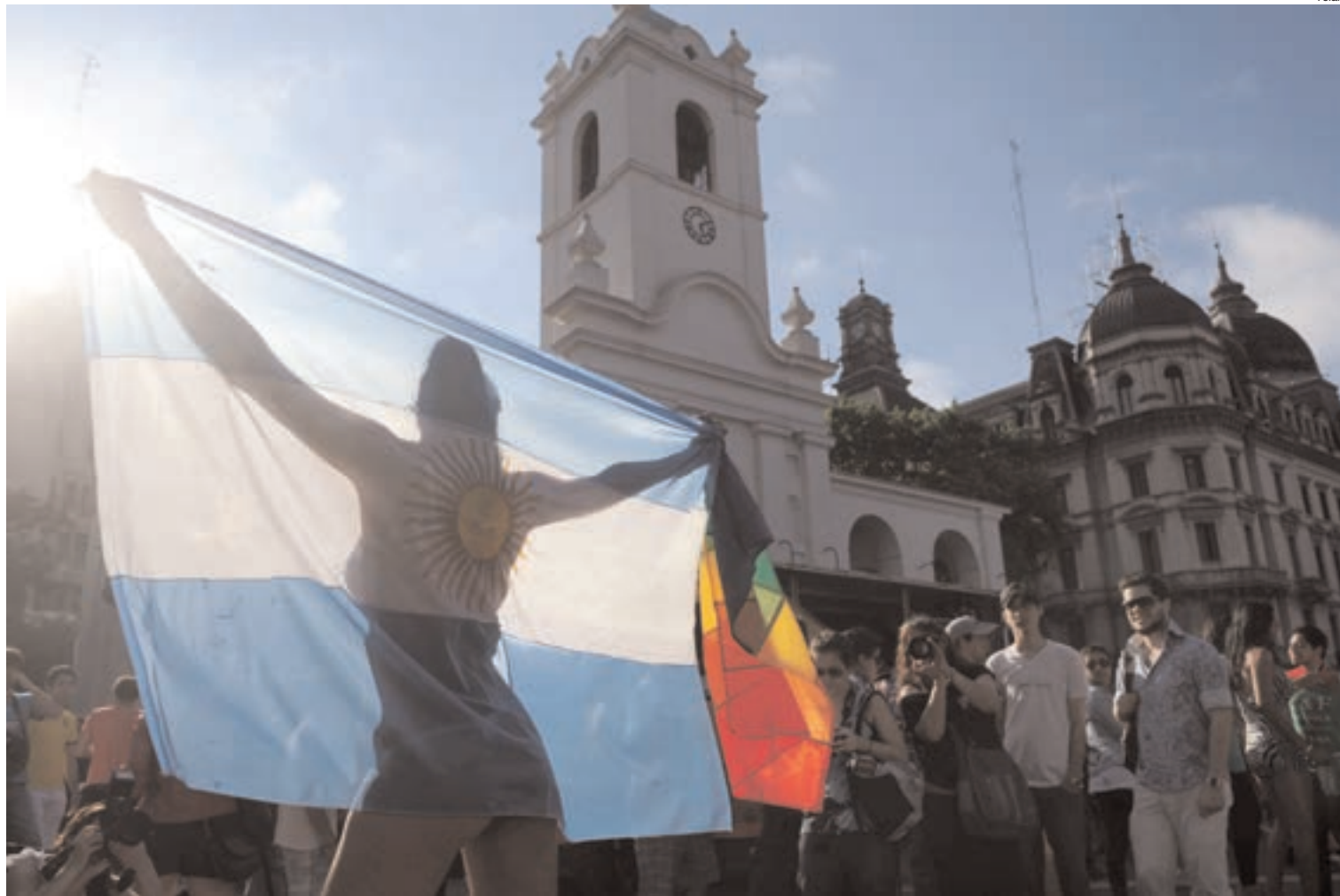
La marcha de este año estaba prevista para el 15 de noviembre, aunque ahora su organización está puesta en duda.

Los organizadores denunciaron que Macri los obliga a ejercer el poder de policía en el acto y los responsabiliza por la seguridad de las miles de personas que asisten. Sostienen que la medida es anticonstitucional y que afecta la libertad de expresión.