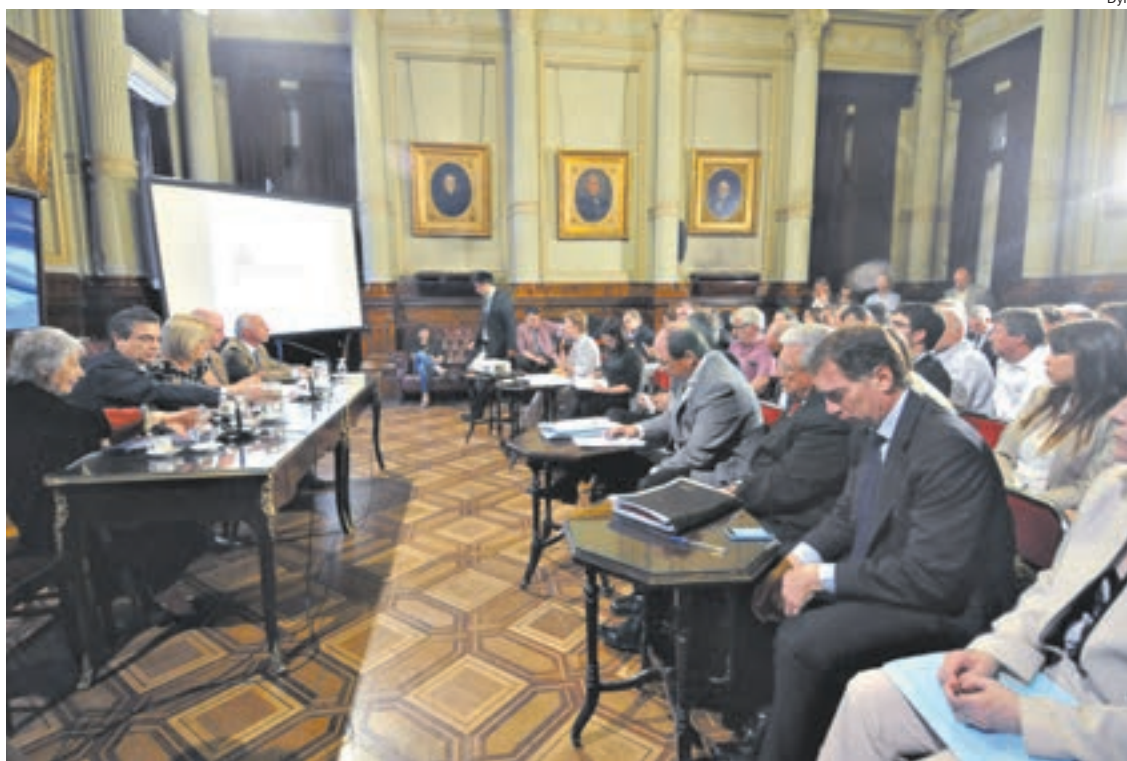
El martes de la semana que viene continuará el debate en la comisión.