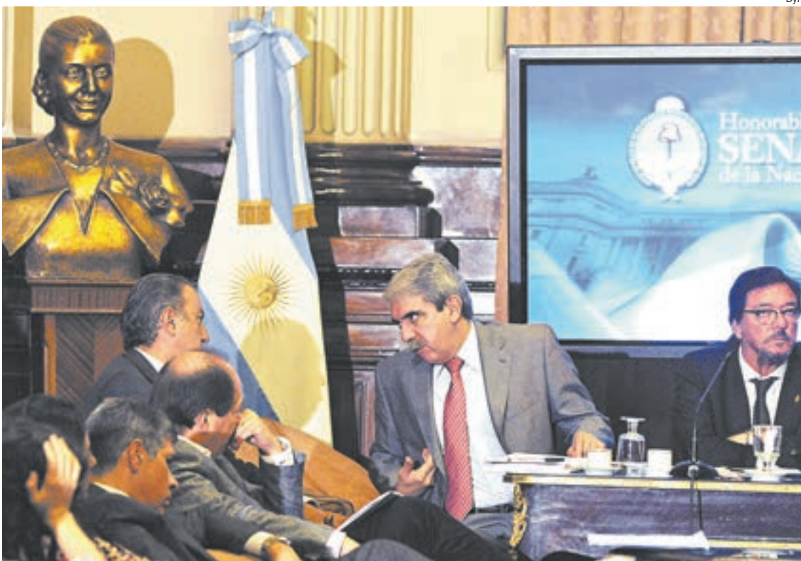
Las comisiones del Senado volverán a reunirse el martes que viene por la tarde.