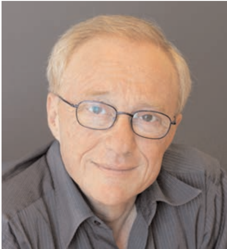
“Escribimos asumiendo que nos comprenderán”, postula David Grossman.

“Bibliotecas, libros, el futuro digital” es otro anzuelo que tentará a curiosos indómitos. Darnton, historiador estadounidense de la Universidad de Harvard, pionero en la historia del libro y cofundador de la primera Biblioteca Digital Pública –disponible desde 18 de abril de 2013–, planteará que a pesar de lo mucho que se ha discutido acerca de la muerte del libro y de la obsolescencia de las bibliotecas, en el actual ambiente digital las biblio-