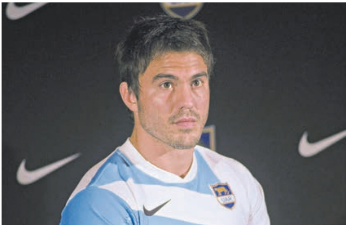
Hernández no toma como especial a este partido, a pesar de que puede entrar en la historia.

Después del amistoso ante Escocia, Argentina tendrá dos compromisos más en su gira europea. El sábado 15 jugará en Génova contra Italia, mientras que el sábado 22 se medirá ante Francia en el Stade de France.