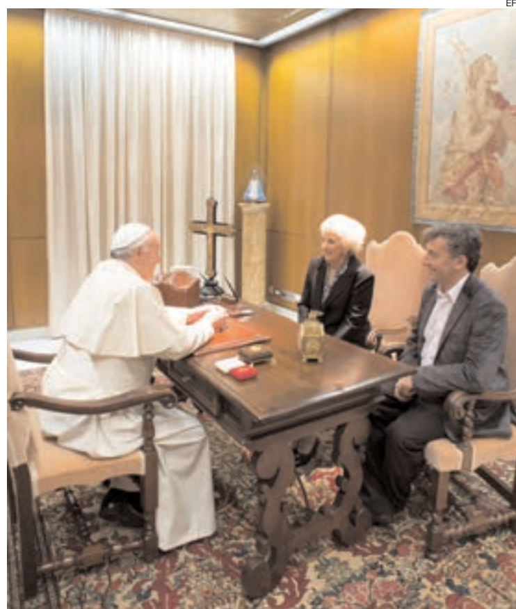
El papa Francisco, Estela de Carlotto e Ignacio Guido Montoya.

También revelaron que el miércoles se mencionaron las críticas que Carlotto había hecho al Papa y que Bergoglio considera “un tema pasado”. “Cuando tuvimos la noticia estábamos reunidos en la casa de Abuelas y todos dijimos ‘¡Uy!’ porque surgió que no habíamos escuchado nunca a Bergoglio hablar de los desaparecidos”, recordó la presidenta de Abuelas, que luego señaló que es “sano, humano y natural” rectificarse. “Entre cristianos sabemos perdonar”, agregó.