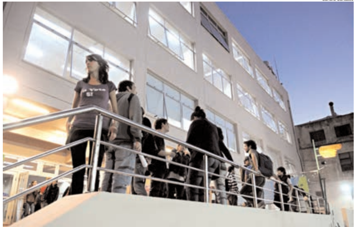
"Las familias agradecen la beca, pero sobre todo el tutor", explican en la universidad.

Para facilitar el ingreso y evitar la deserción, la UBA ofrece un programa de apoyo económico y cultural para alumnos de escuelas secundarias de las zonas más desfavorecidas de la Ciudad.