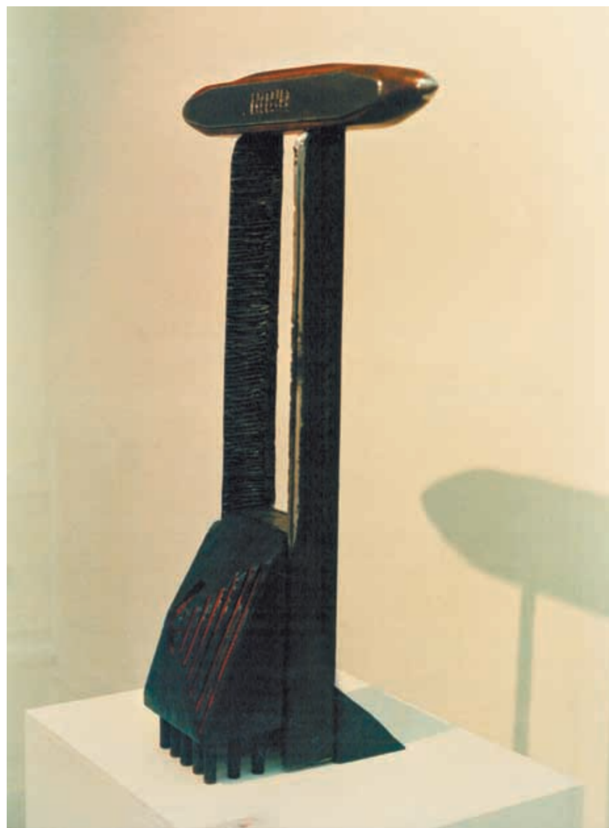
Madre del corazón arrancado.