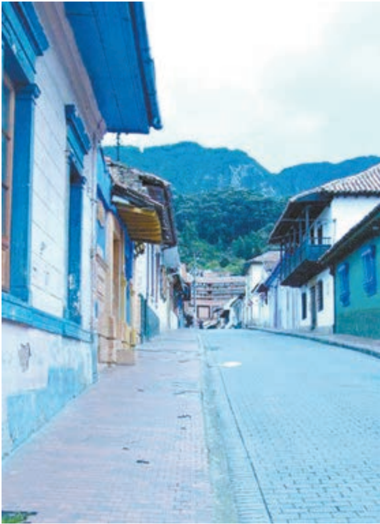
Tanto el recorrido histórico por La Candelaria como la modernidad de Bogotá comparten el darle valor a la cultura.

Otro sitio importante en el centro histórico de Bogotá es el Museo Botero, que contiene obras del gran artista plástico colombiano Fernando Botero. El lugar donde está emplazado (junto al Museo de la Moneda) también tiene su historia. Era una casa muy pequeña con un lote baldío que en 1724 fue comprada por el Arzobispo Claudio Antonio de Quiñonez. El inició la construcción de este terreno, pero falleció en 1736. Ya en ese momento, la casa estaba adecuada para ser habitada por religiosos. Entonces, se convirtió en el primer Palacio Arzobispal de la ciudad hasta 1862, cuando en un encuentro de conservadores, la casa fue incendiada y destruida. En 1985, cuando sucedió la toma del Palacio de Justicia en la Plaza de Bolívar, funcionó temporalmente allí la Corte Suprema de Justicia, mientras se construía nuevamente el Palacio de Justicia. Y en el año 2000 llegó la obra: Botero donó su colección privada, con el fin de almacenarla en un solo lugar abierto al público y totalmente