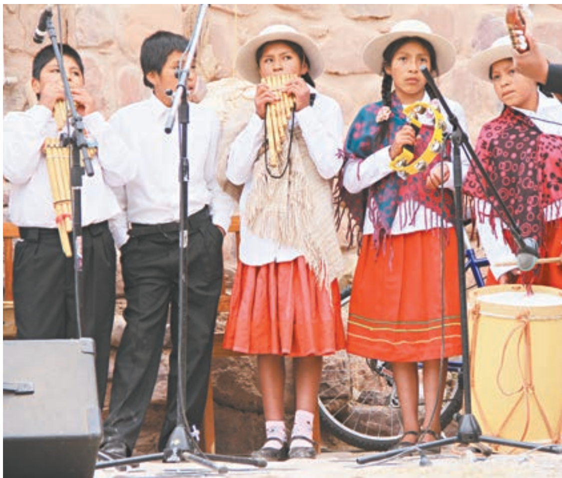
El piberío va al Tantanakuy a mostrar sus artes, a pertenecer, a reafirmar una identidad.

Motorizado por Jaime Torres y su grey, este encuentro –eso significa su nombre en quechua– se propone recuperar, revalorizar y mantener en tiempo presente las raíces culturales de las etnias andinas a través de sus expresiones artísticas.