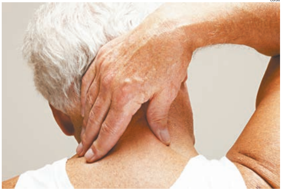
"Es un déficit cerebral originado bruscamente y que se manifiesta con una pérdida de una función cerebral."