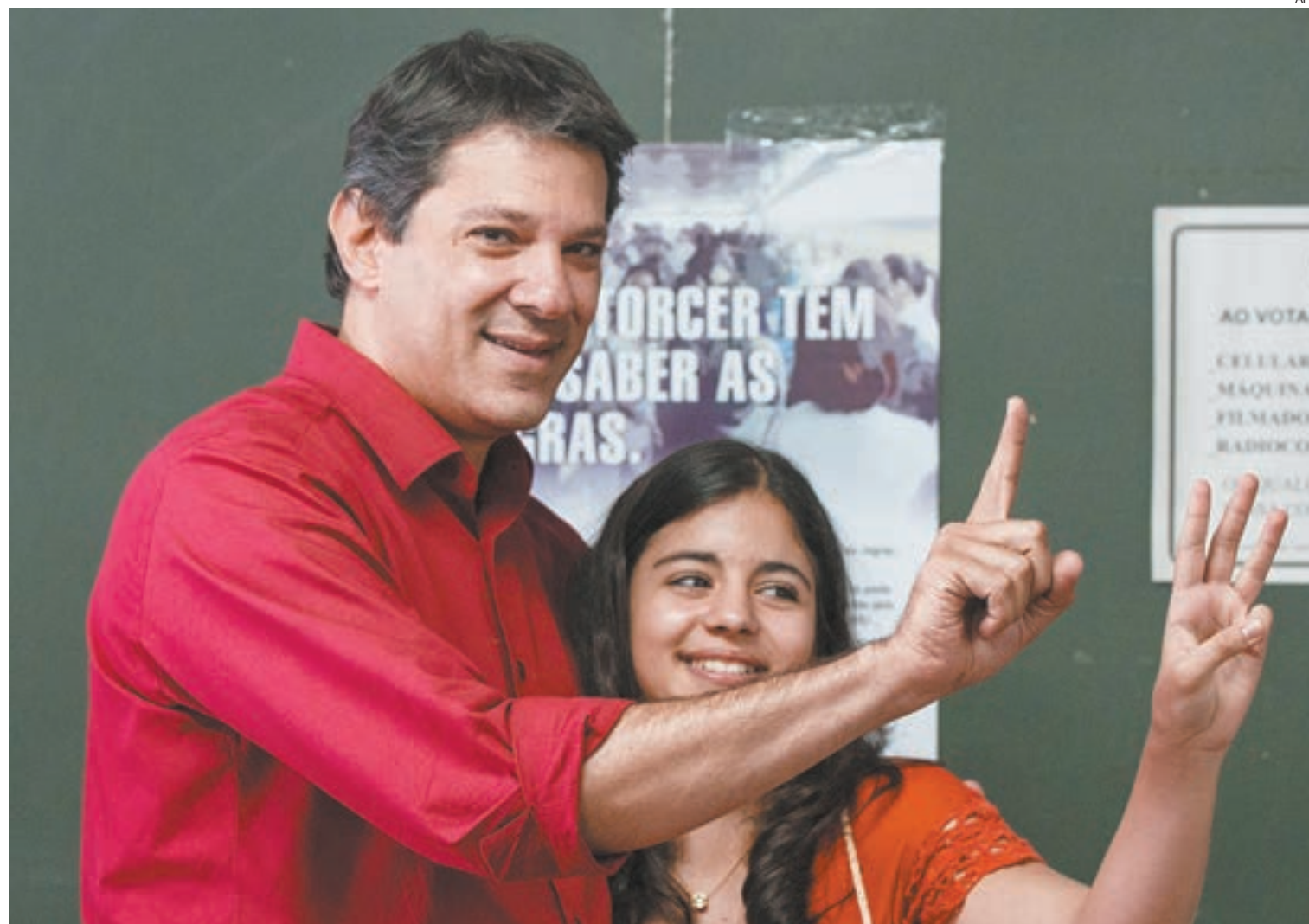
Fernando Haddad saluda triunfante junto a su hija, después de votar en la elección municipal de San Pablo.

Los once puntos de ventaja frente al adversario dieron a la victoria de Haddad un sabor de revancha personal para Lula, confirmando una vez más la increíble intuición política del ex presidente y reordenando el tablero de cara al 2014.