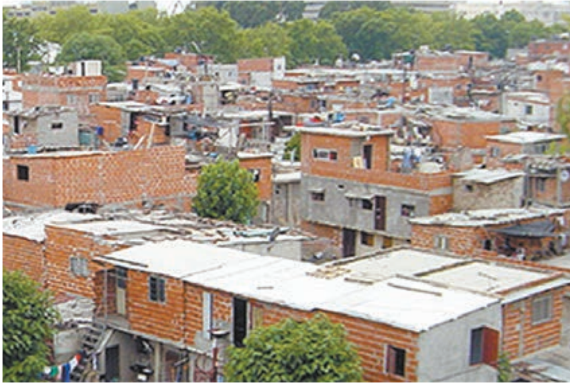
En la Villa 21-24 de Barracas viven casi 60 mil habitantes.

Es la villa más poblada de la Ciudad. La comisión de vecinos estaba en manos del macrismo, pero ayer las agrupaciones que integran Unidos y Organizados se impusieron en las elecciones.