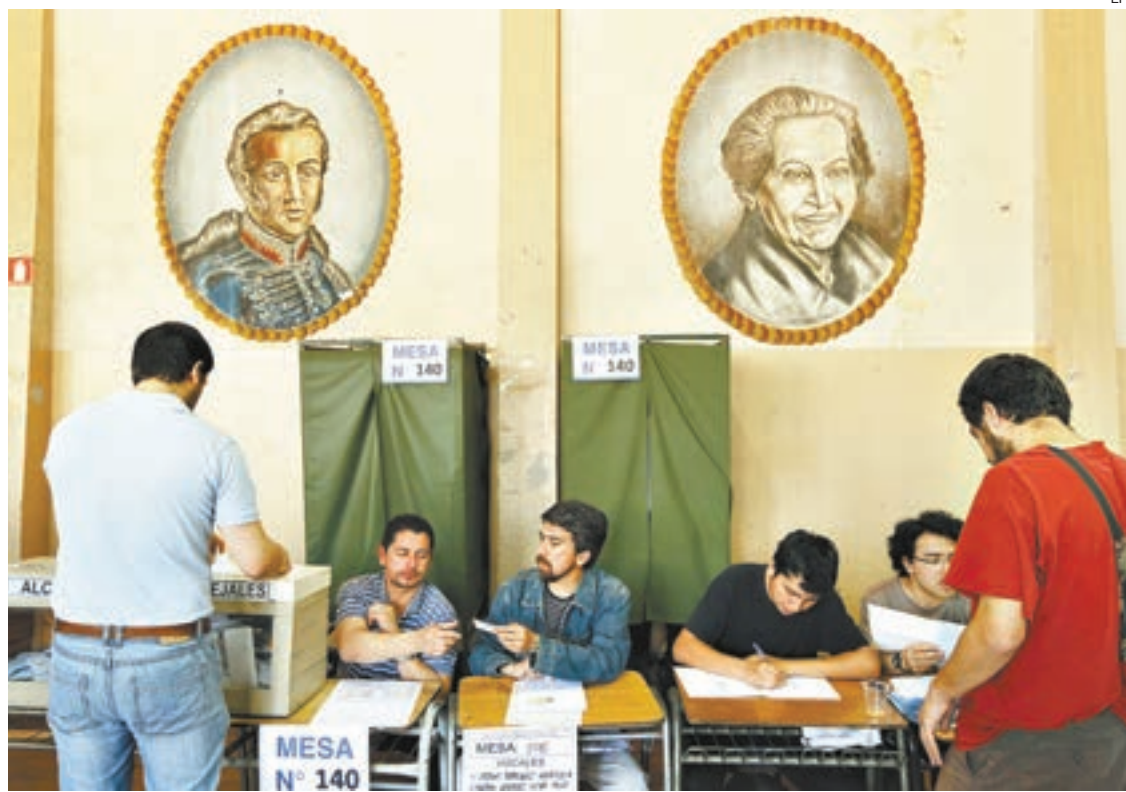
Ciudadanos depositan su votos en Santiago durante las elecciones municipales.

En el caso de la elección de concejales, el primer cómputo tota-