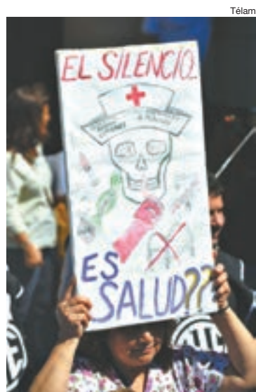
Protestas contra el Centro Cívico.