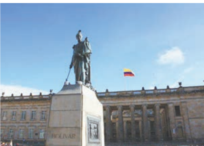
La Plaza Bolívar es un emblema del centro histórico bogotano.

ya que está siendo sometido a un riguroso proceso de restauración y remodelación. Y uno de los planes más ambiciosos es que volverá a ser un centro de producción. Es que durante mucho tiempo, se produjo ópera, teatro y danza, pero en los '90, con el auge de las políticas neoliberales, los dejó de producir y era alquilado a empresarios. Como próximamente volverá a ser un centro de producción de obras de teatro y danza, la tercera etapa de restauración y modernización del Teatro Colón incluye la creación de espacios para poder llevarlos a cabo.