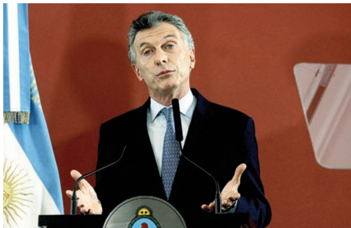
Mauricio Macri se alegró por la continuidad de la UCR en Cambiemos.

El PRO y la UCR dicen que Cornejo no logrará sumar más sectores políticos a Cambiemos. El macrismo podría aceptar un vice radical.