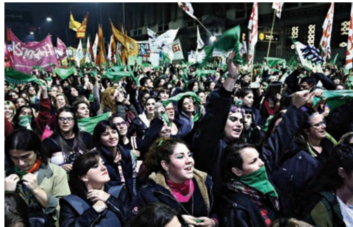
Nuevamente la marea verde se adueñó del Congreso y sus alrededores.

Actos en todo el país en apoyo de la octava presentación del proyecto para la legalización de la interrupción voluntaria del embarazo.