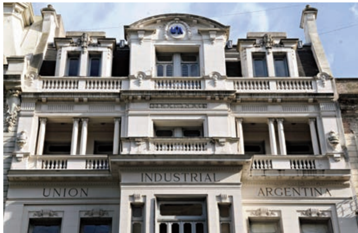
La UIA con los tapones de punta. “Hay medidas de sesgo antiexportador que penalizan el agregado de valor.” I DYN

En un documento en el que cuestiona recientes medidas del Gobierno, la central fabril advierte sobre la destrucción del empleo industrial.