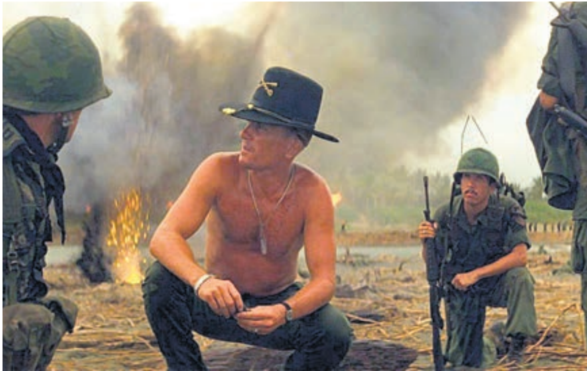
El Coronel Kilgore (Robert Duvall) ordena un ataque en la playa para que sus hombres puedan hacer surf.

Francis Ford Coppola presentó un nuevo corte ¿final? de la que sigue siendo una de las más grandes películas de todos los tiempos.