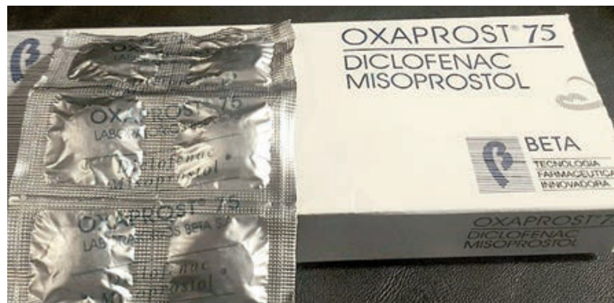
El misoprostol actualmente cuesta algo menos de 6000 pesos.

El aumento del precio del medicamento dificulta el acceso de las mujeres a la salud, según un informe difundido ayer.