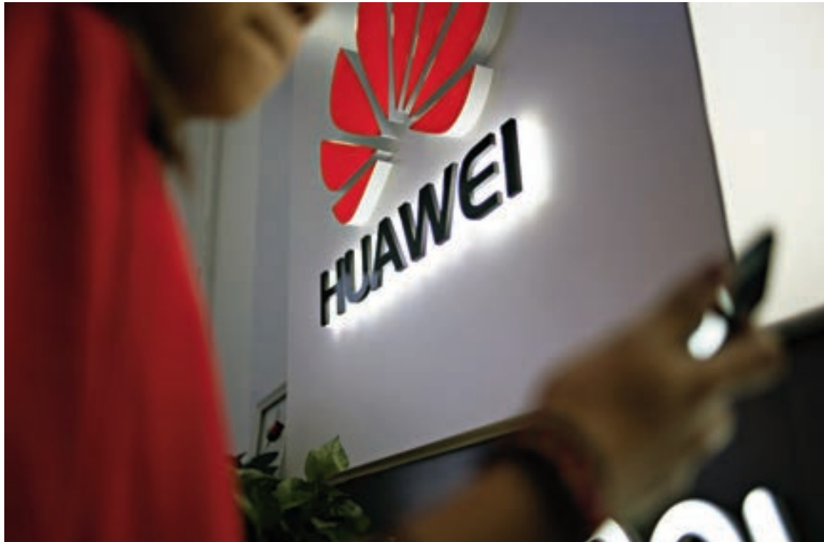
En medio de la disputa comercial EE.UU.-China, Huawei recibió el apoyo de Venezuela.

En México, la compañía apuntó a dos sectores estratégicos: los jóvenes y los segmentos premium. Hoy figura entre las tres primeras.