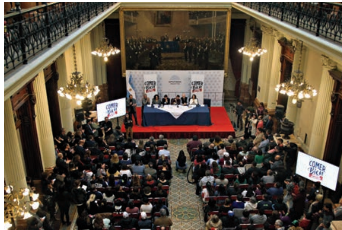
En el Congreso, del encuentro participaron legisladores y dirigentes de distintos espacios opositores.

La CTEP, Barrios de Pie y CCC presentaron la campaña Comer Bien, que apunta a instalar en la agenda pública el problema del hambre.