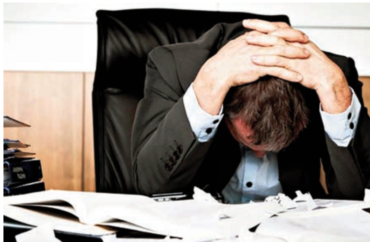
El estrés laboral y la adicción a los videojuegos entraron en la Clasificación Internacional de Enfermedades.

La OMS señaló que los trastornos identificados fueron incluidos en la CIE para que los profesionales de la salud y los Estados refuerzan medidas de prevención y tratamientos.