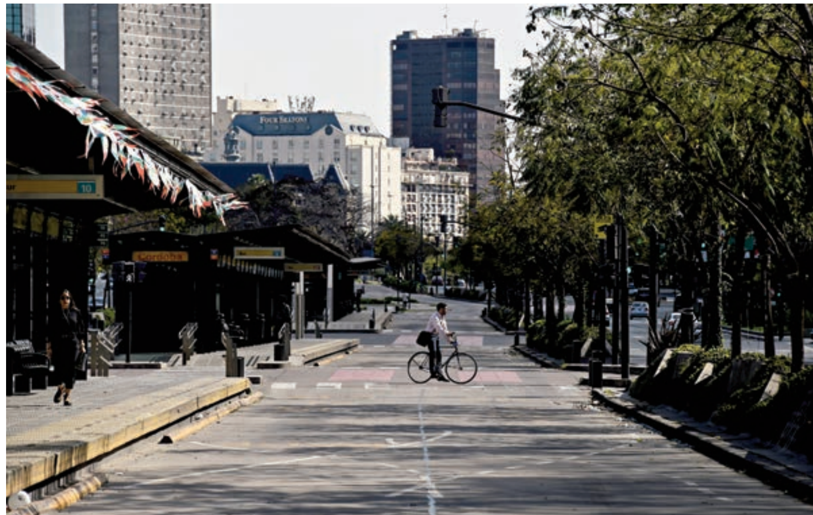
La imagen de una ciudad vacía se repetirá por quinta vez desde la llegada de Macri al gobierno.

La huelga de 24 horas cuenta con la adhesión del Frente Sindical para el Modelo Nacional, las CTA y las organizaciones sociales. Se prevé contundente.