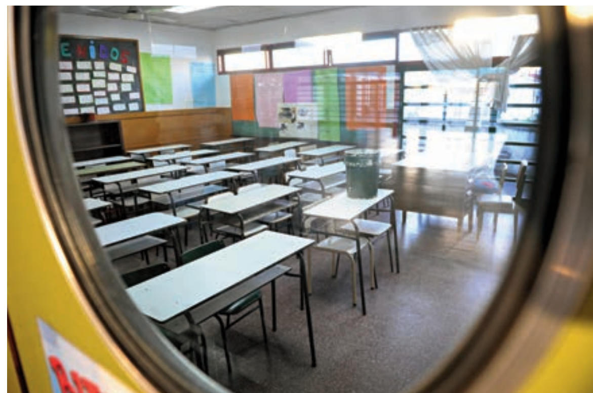
La descentralización de la educación significó menos recursos y, además, discontinuidad de políticas. I NA

Un análisis del uso de los recursos públicos señala que la suba del gasto destinado a la deuda afectó la infraestructura social, educación y ciencia.