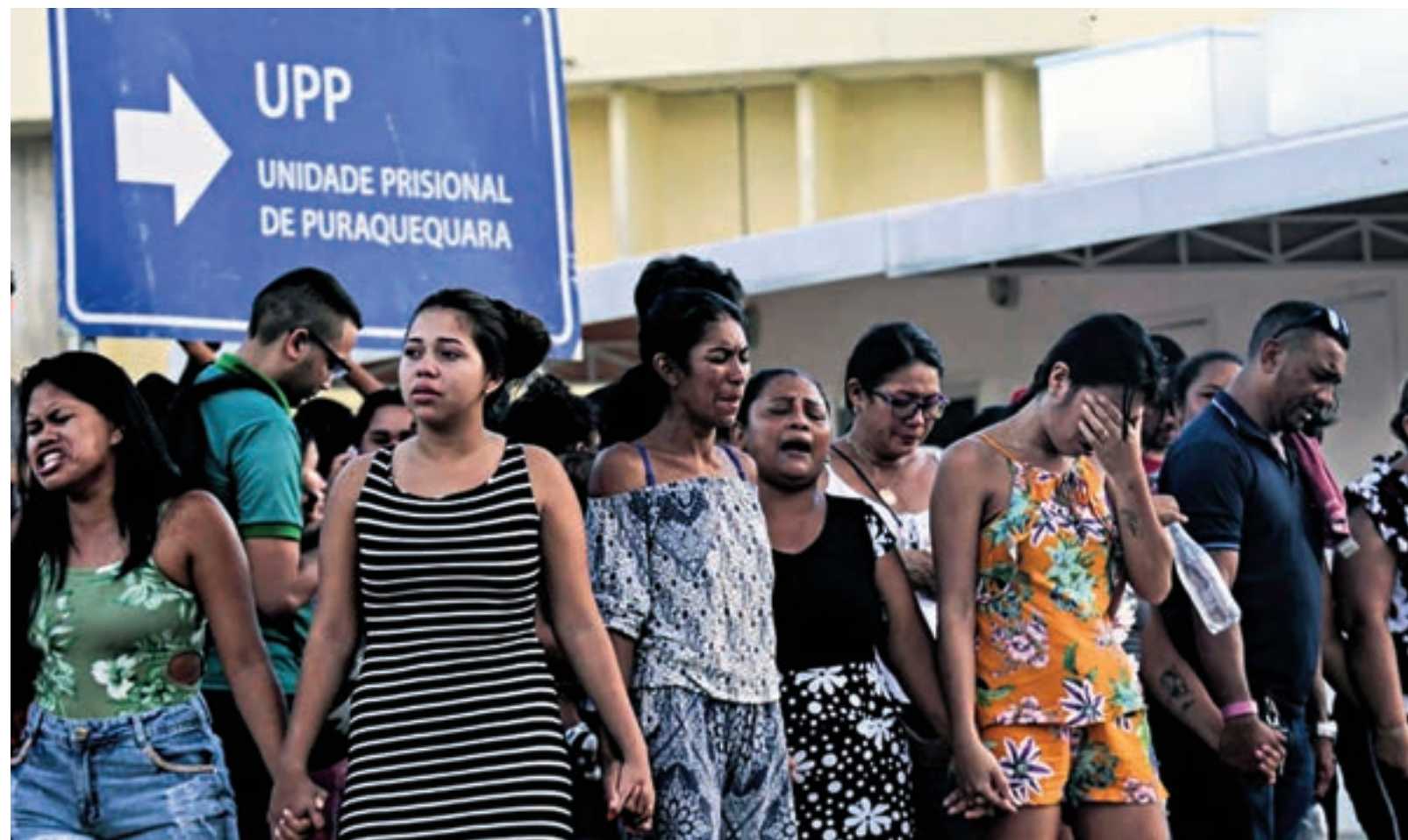
Familiares de los presos rezan afuera de una de las cuatro cárceles de Manaus, en el estado de Amazonas.

La hipótesis sobre la que trabajan las autoridades es que los 55 asesinatos fueron un ajuste de cuentas de dos facciones narcos. El hacinamiento carcelario.