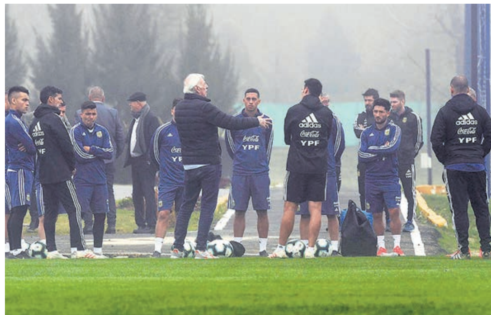
Menotti abrió la práctica con una charla ante los jugadores que terminó con un aplauso.

El vuelo en el que venía el crack del Barcelona fue desviado a Aeroparque por la niebla y por eso no pudo entrenarse con el grupo. Eso sí, hubo encuentro cumbre con Menotti.