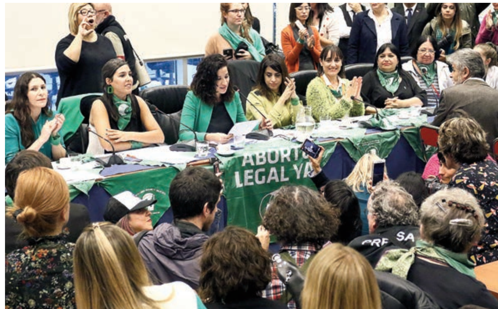
La conferencia de prensa en la que la Campaña anunció la 8ª presentación del proyecto de IVE en Diputados.

Por octava vez consecutiva, la Campaña presentó su proyecto de IVE en Diputados. Un amplio arco de diputadas y diputados acompañó el texto y se comprometió a la media sanción.