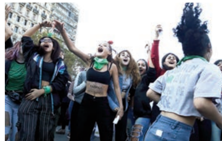
Los cánticos de las mujeres acompañaron al pañuelazo.

gente en las calles con el pañuelo verde “como si se estuviera debatiendo y recién lo estamos presentando al proyecto”, dijo. Y agregó: “Nos comprometemos a que tenga media sanción, este año, que es electoral”. “Clandestinidad o ley es la elección que tienen que hacer los candidatos y candidatas”, desafió.