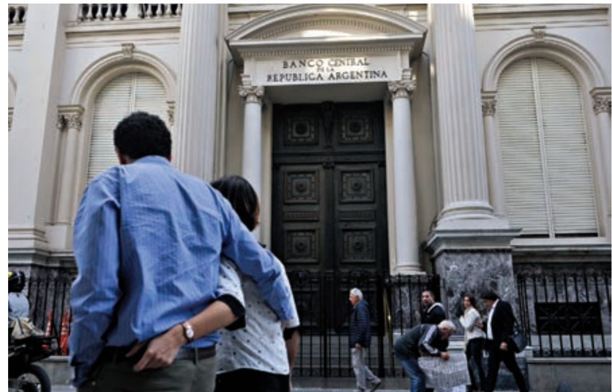
El Banco Central no detiene la sangría, incluso con tasas de cortísimo plazo arriba del 70 por ciento.

El consorcio de bancos IIF advierte sobre presiones crecientes antes y después de las elecciones.